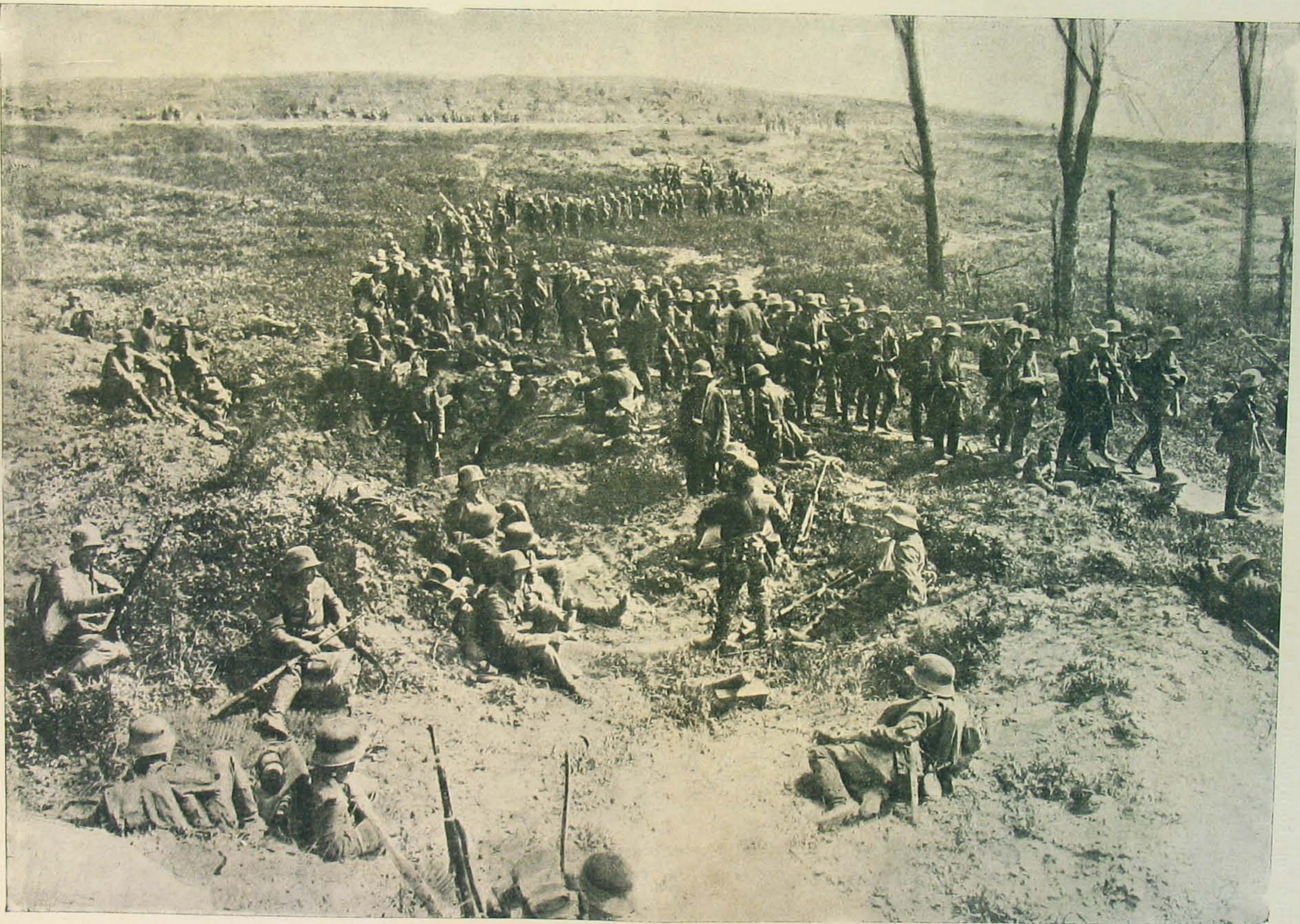
Átvonulás a Chemin des Dameson.