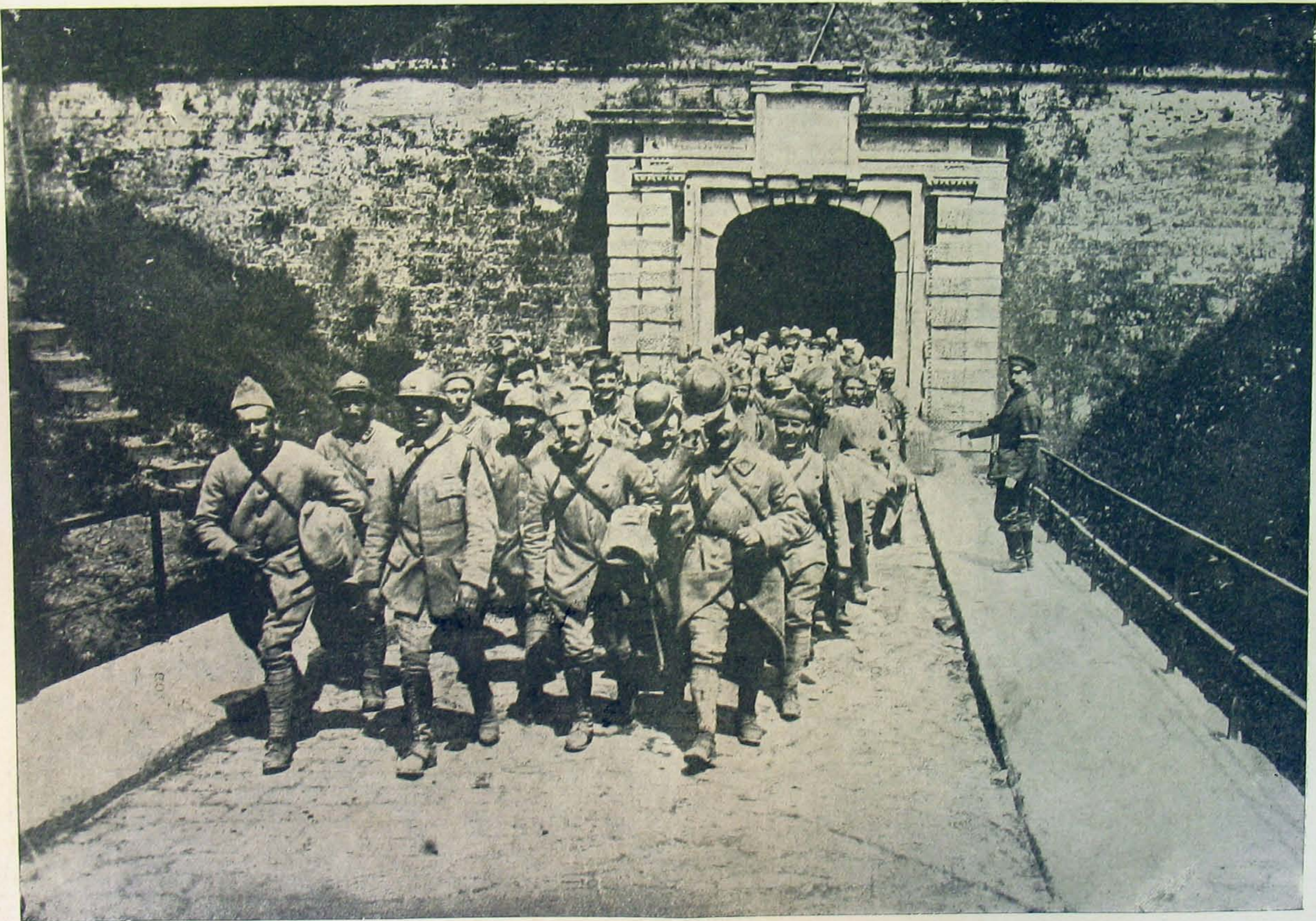
Az első fogolycsapat beszállítása a laoni czitadellába.