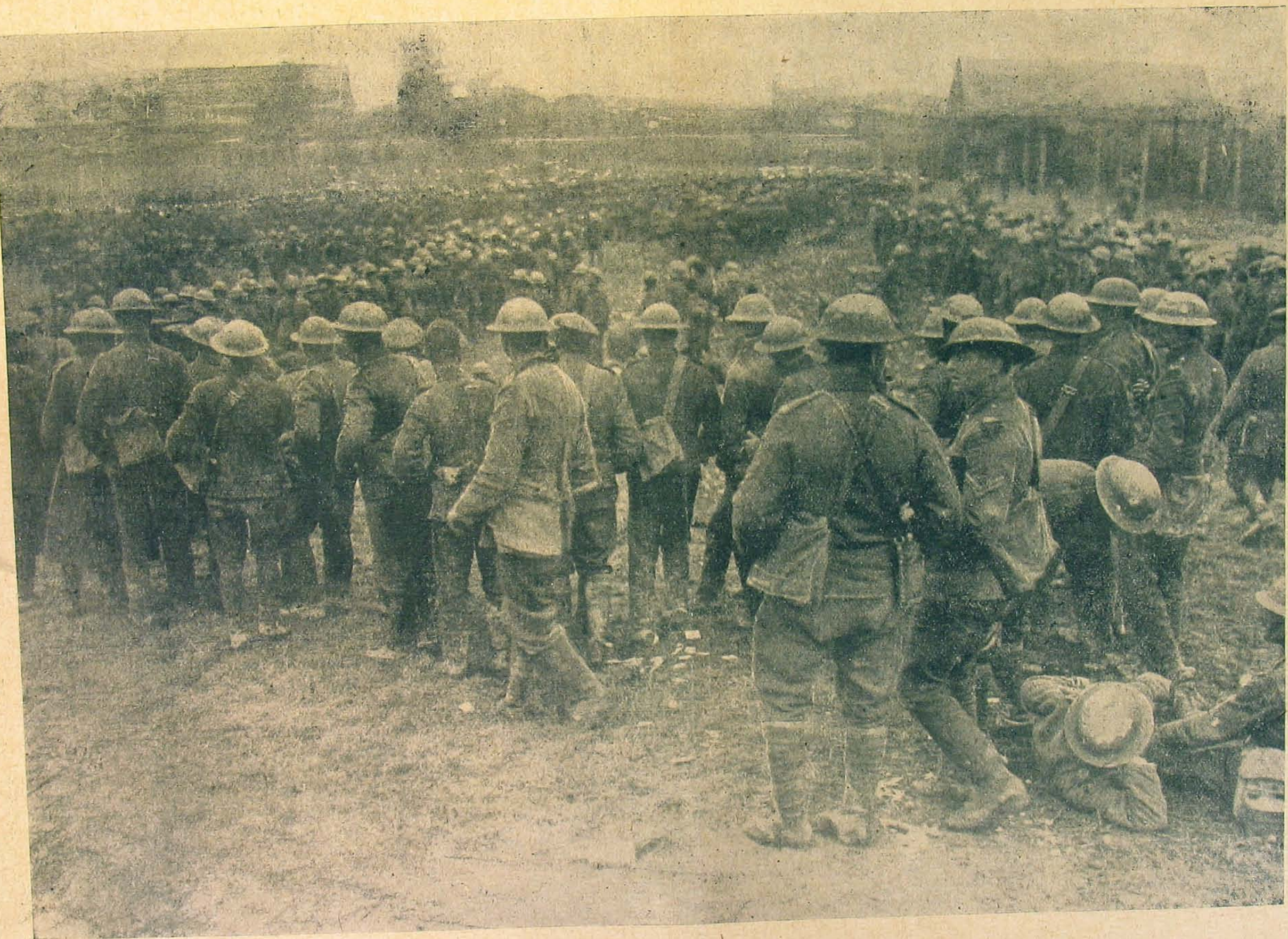
Az első angol foglyok egy gyűjtő-állomáson.