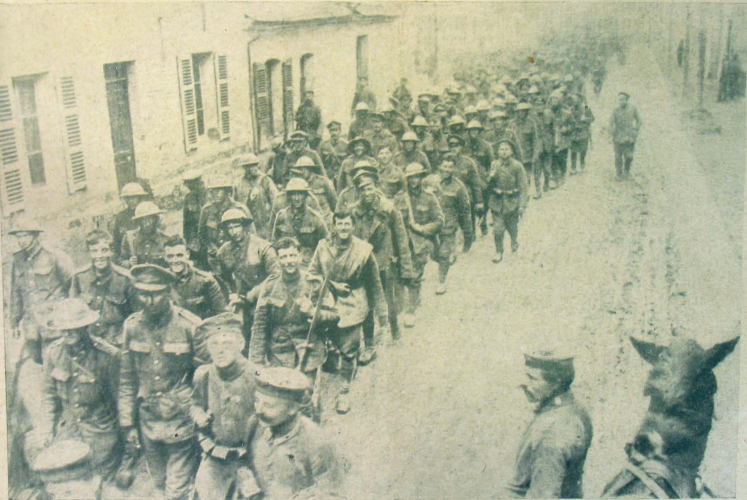
Angol fogoly-szállítmány egy St.-Quentin melletti helységben.