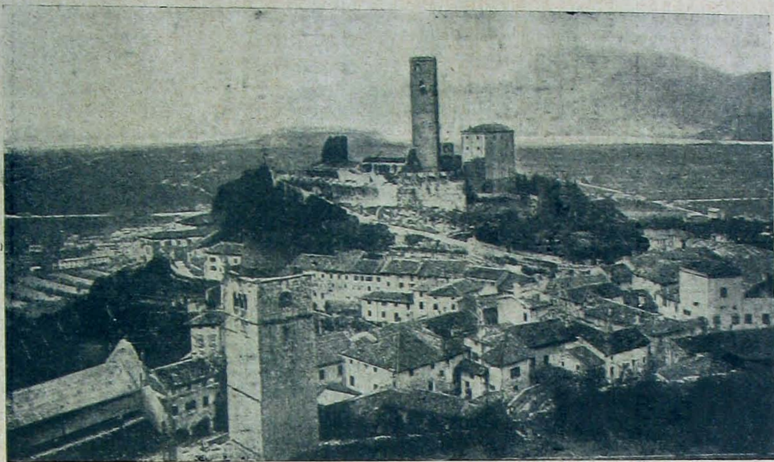
Gemona, melynek hatalmas erődjait Krauss tábornok csapatai foglalták el.