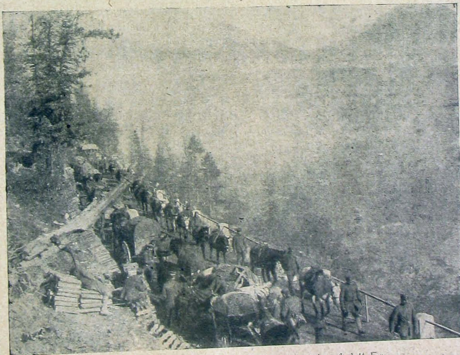
Előnyomulásunk útja Cividale felé, háttérben a visszafoglalt Krn.