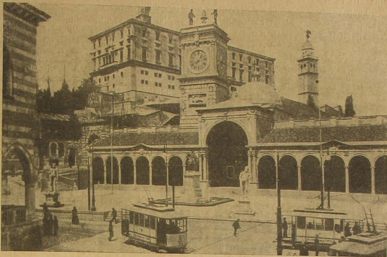
Viktor Emánuel-tér Udineban.

de Metternich megtagadta tőlük a segítséget, a mit tőle kértek, úgy hogy csak 1821-ben, hat évvel a bécsi kongresszus után, a mely meghozta a «tartós európai egyensúlyt», tört ki teljes erővel a görögök szabadságvágya és a harcok, mint ismeretes, a Törökországtól való elszakadással és az önálló görög királyság megalapításával végződtek.