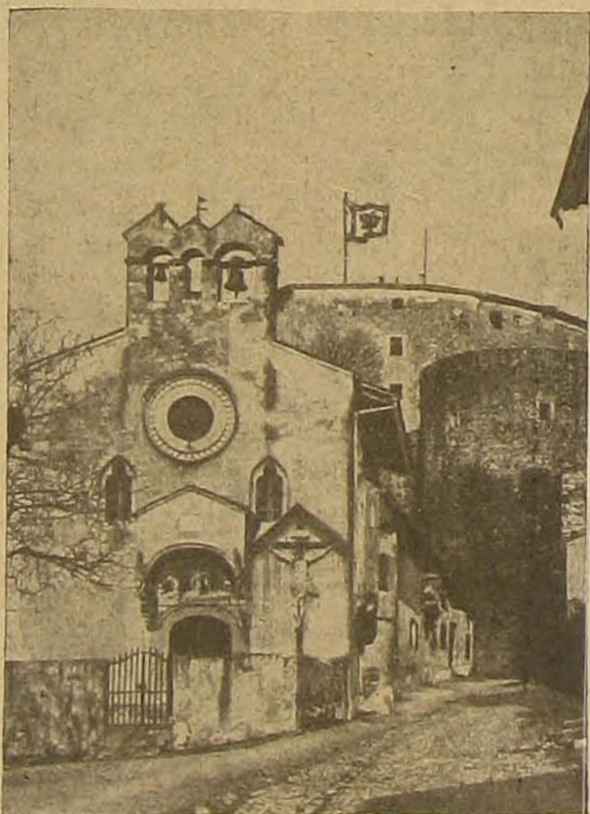
Oszttrák zászló a görzei várfokon.

Novemberi előléptetések. Az idei novemberi előléptetés, a mint azt lapunk hivatalos részében teljertalmulag közöljük, 1 ezredesnek, 3 alezredesnek, 1 őrnagynak, 16 főhadnagynak, 1 hadnagynak, 1 százados-számvivőnek és 1 hadnagy-számvivőnek hozta meg az örvendetes előmenetelt.