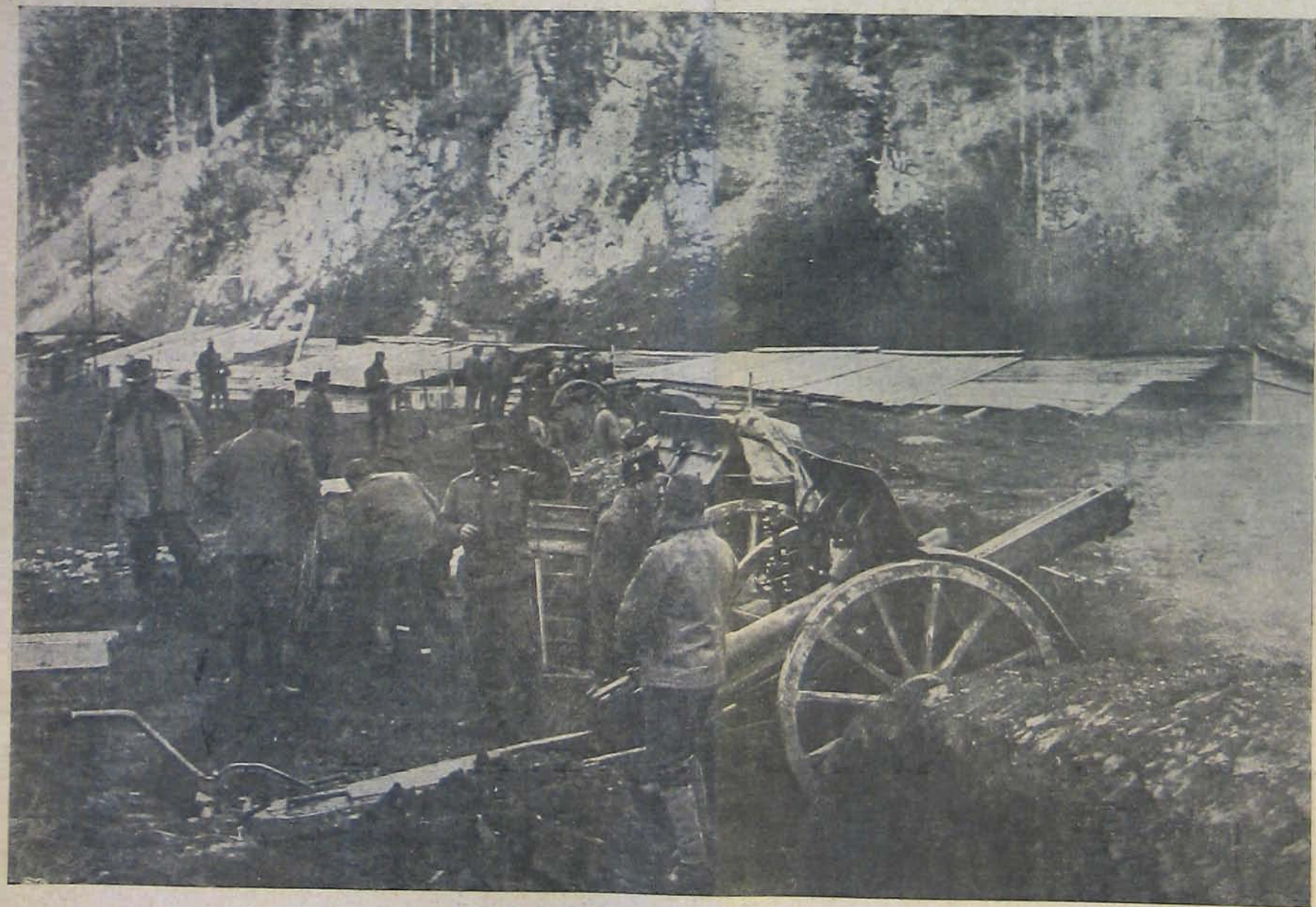
A román frontról. — Tábori tüzérségünk.