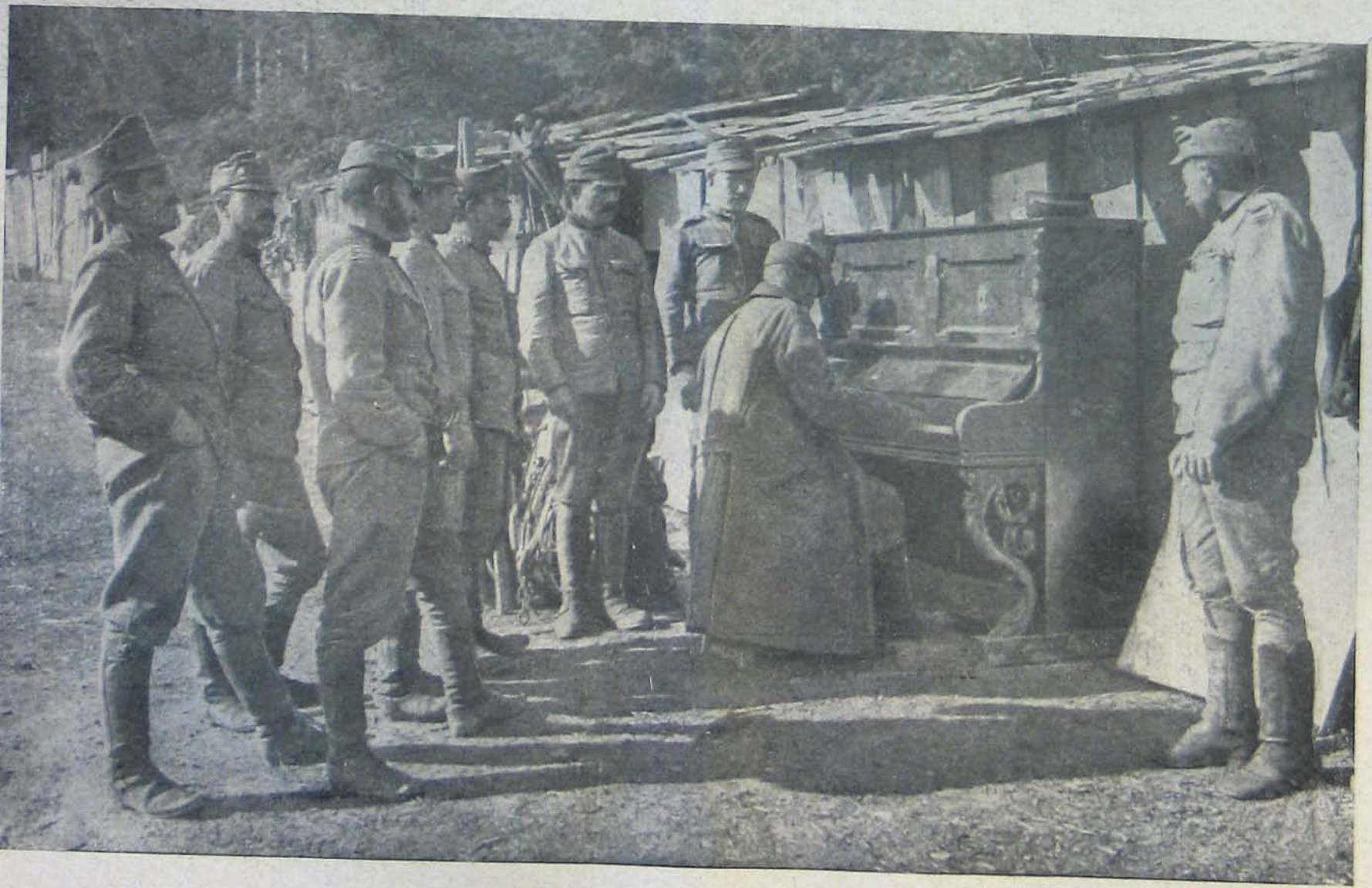
A román harcterről. — Zene a fronton.