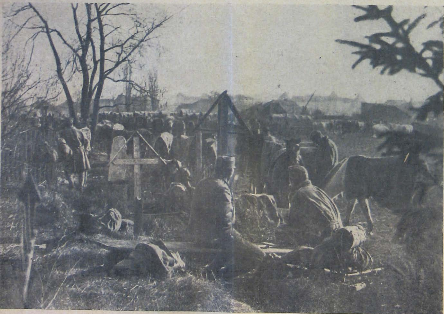
Temetőben táborozó csapatok Csikszeredán.