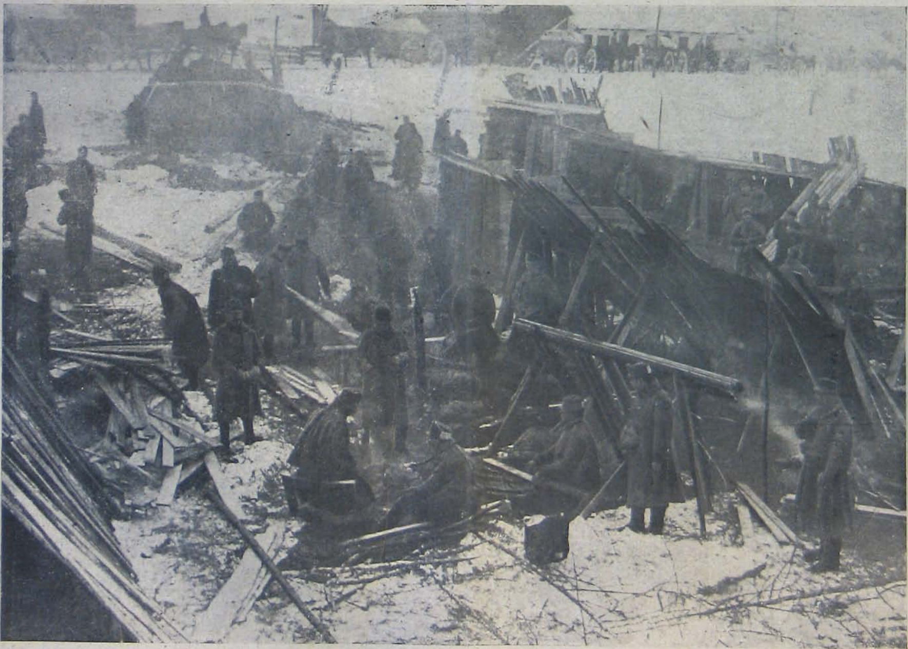
Deszkából épült sátoztábor Hágóiálján.