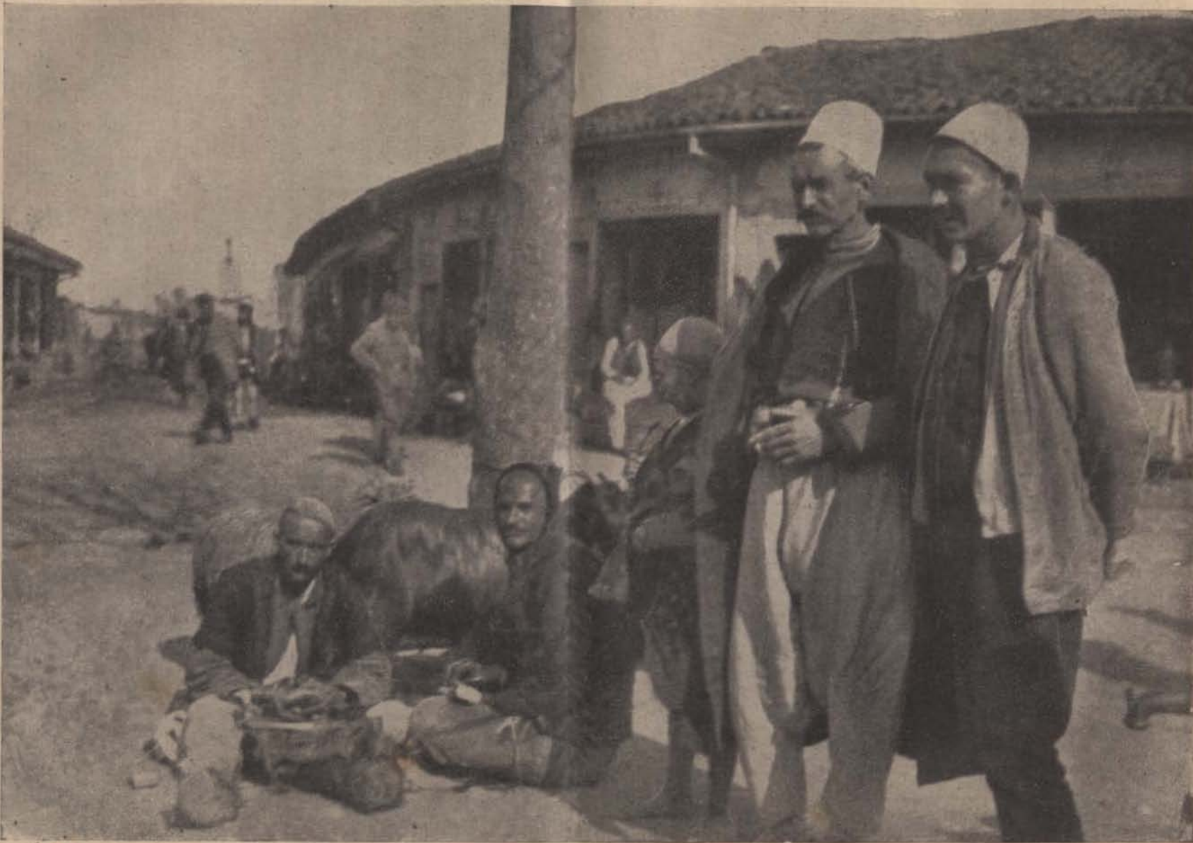
Albániai képek. — Utezi kép Alessióból.