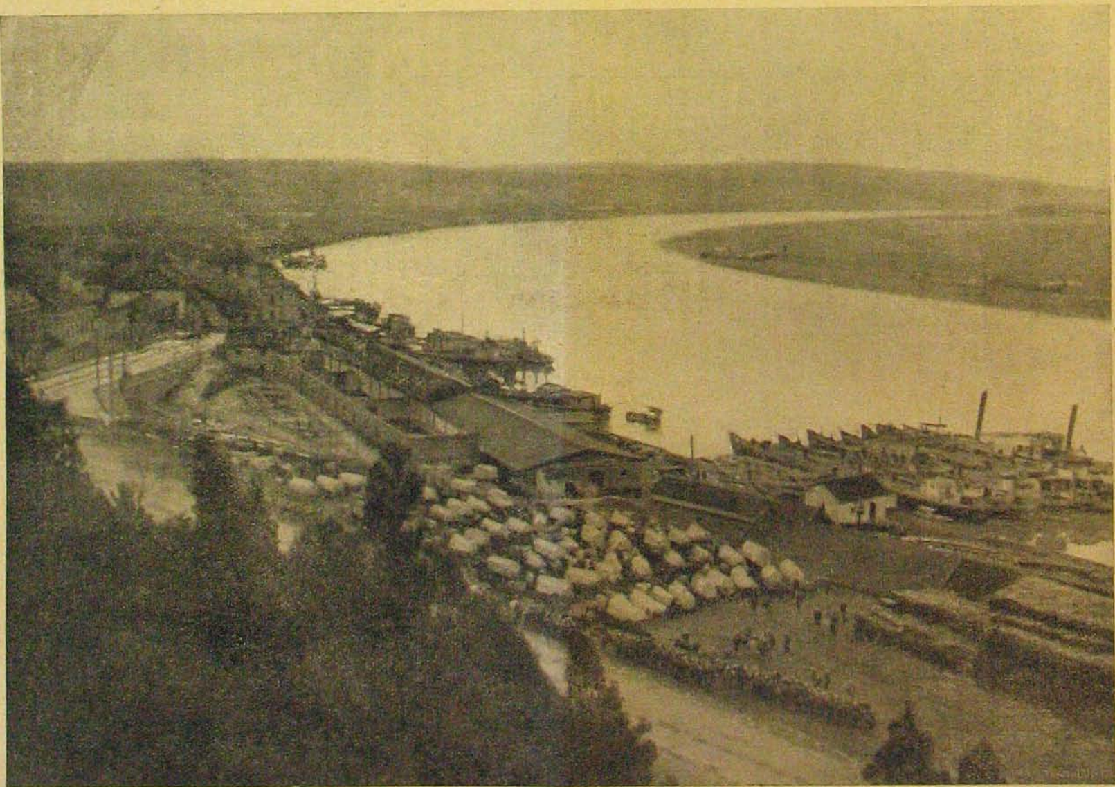
Belgrádi képek. — Kilátás a Kalimegdánból.