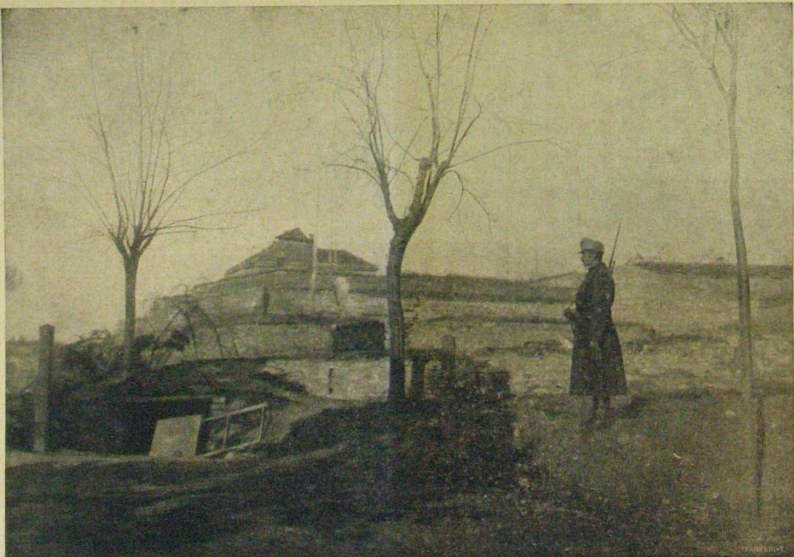
Belgrádi képek. — Magyar baka áll őrt a Kalimogdánon.