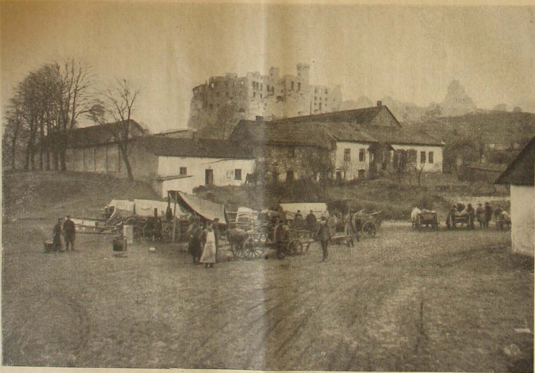
Az északi harcztérről. — Honvéd népfőlkelő tábor a podzamezei romok előtt