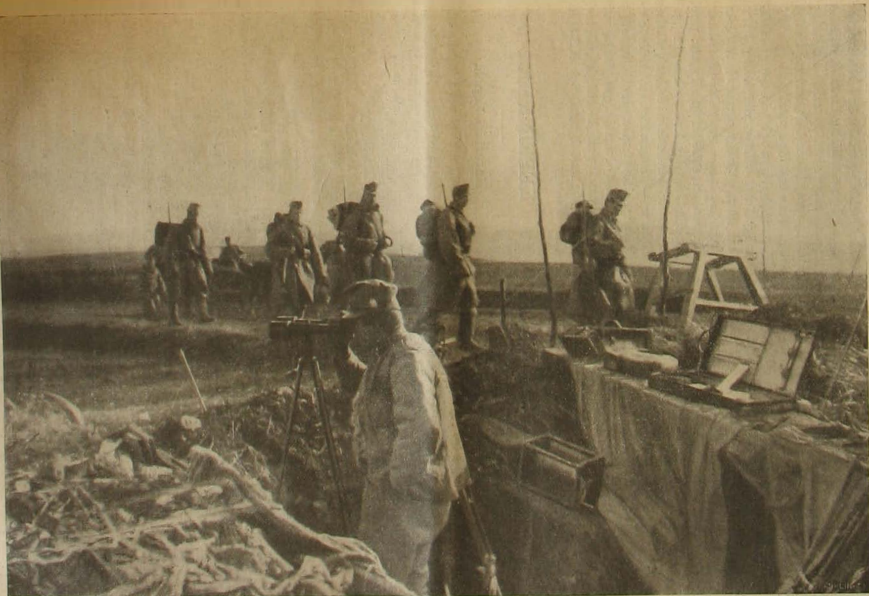
Az ószaki harcztérről. — Figyelő-állomás Piliova előtt.