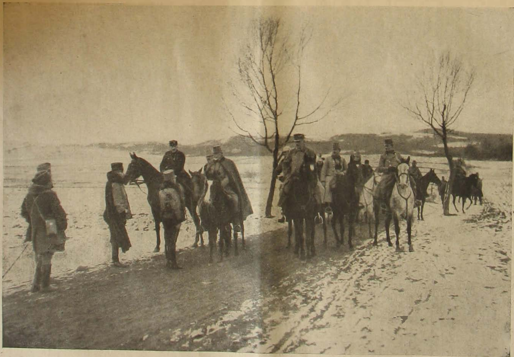
Az északi harcztérről. — Vezérkar az országúton.