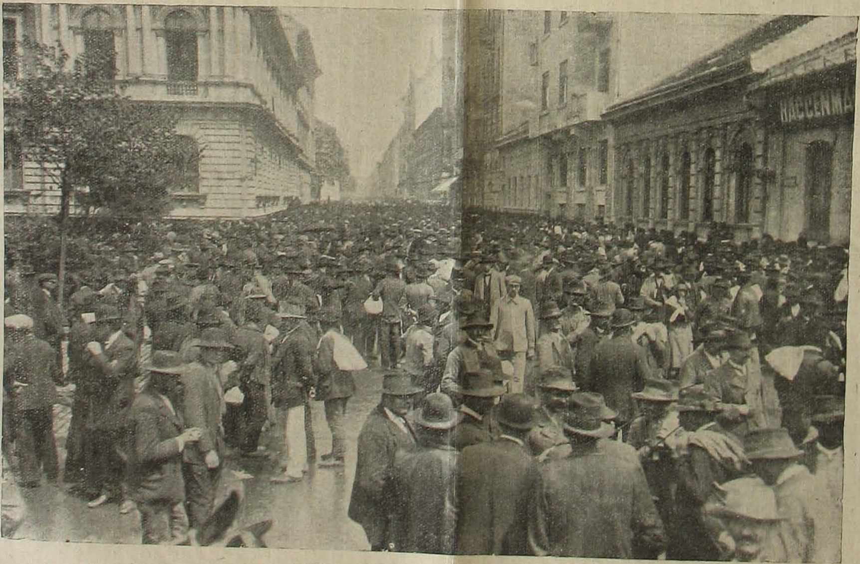
A háboru mellett. — Jelentkező népfelkelők.