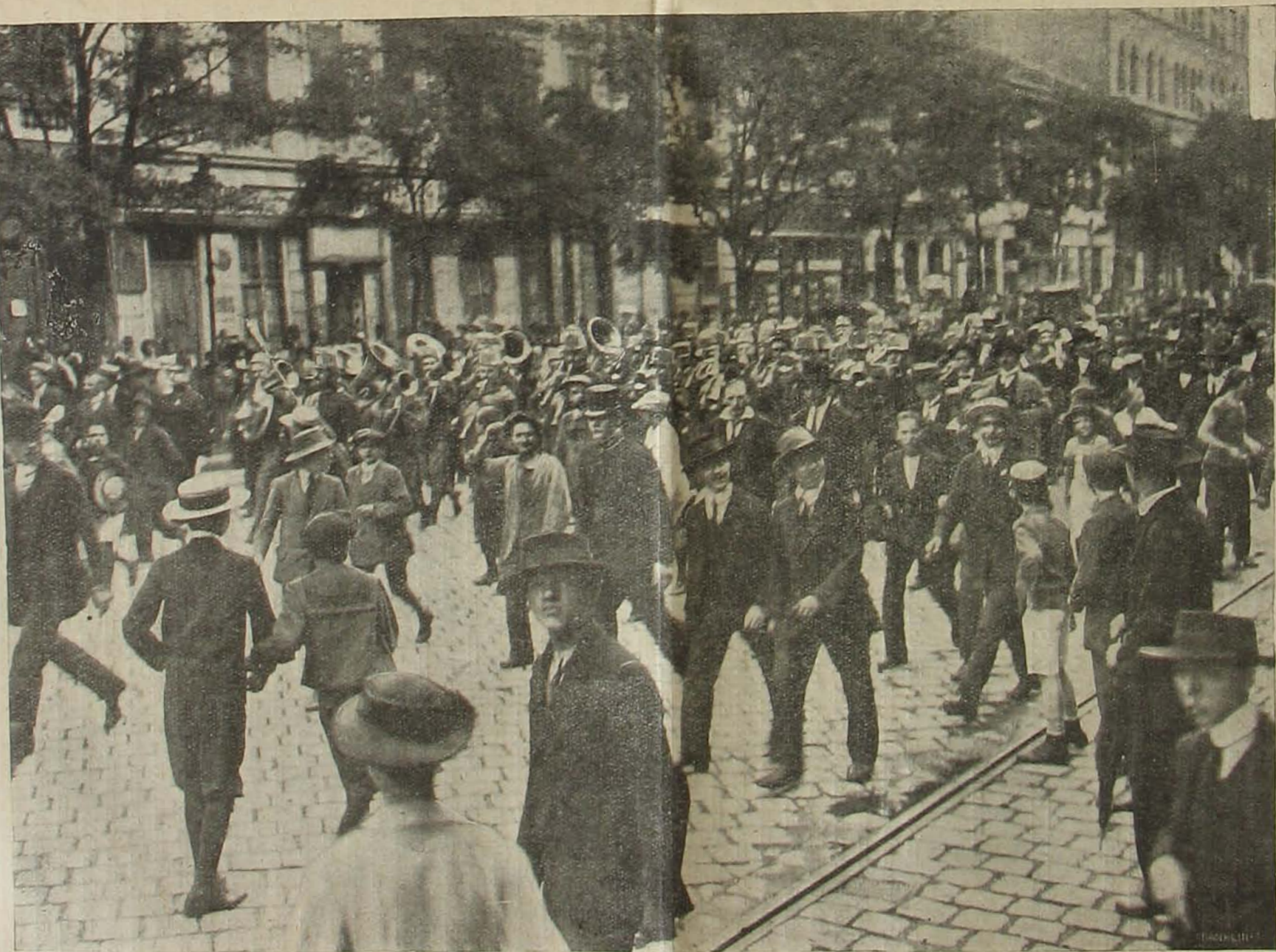
A háboru mellett. — Tüntető felvonulás Budapesten katonazenével.