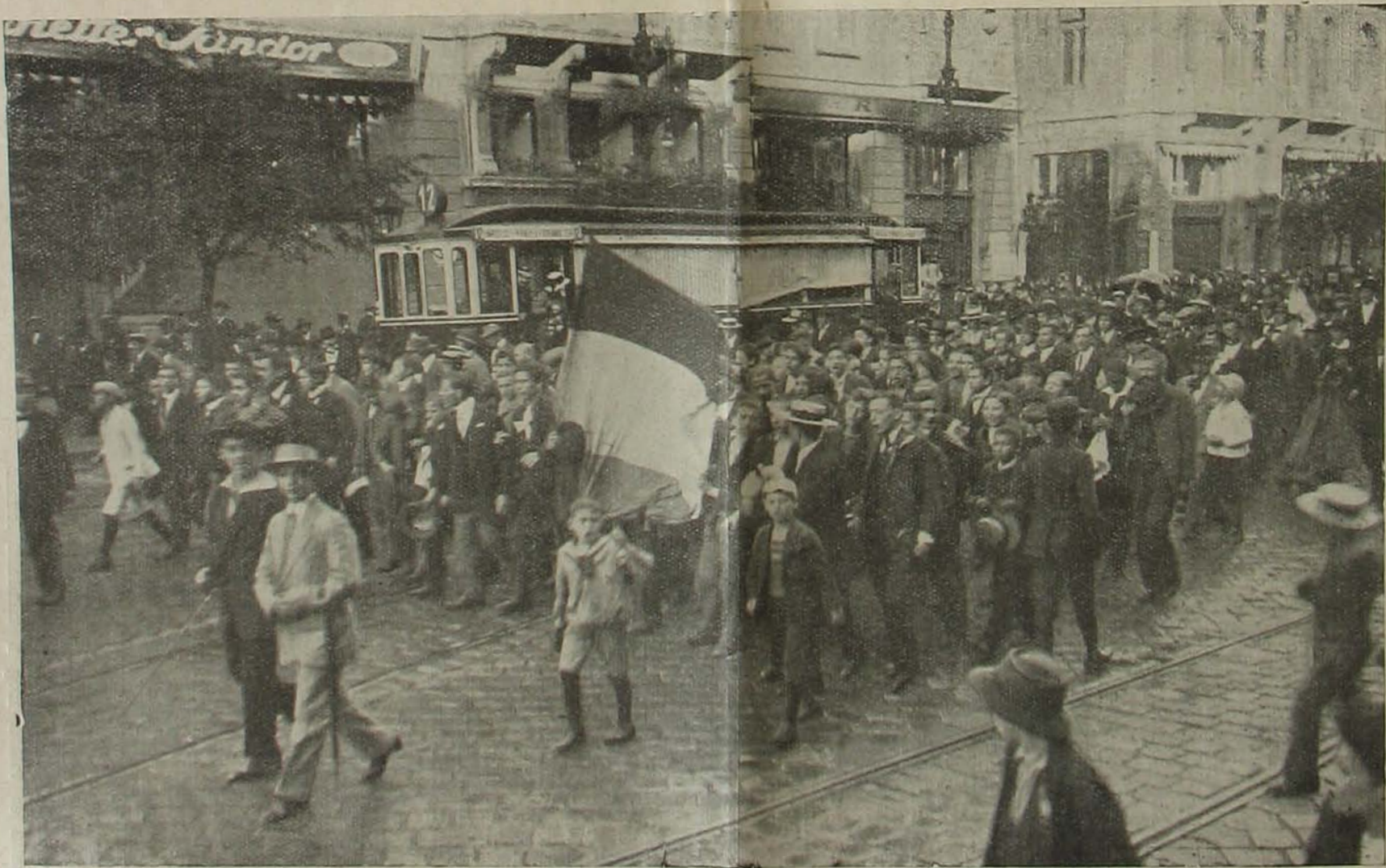
A háboru mellett. — A nagy köruton.