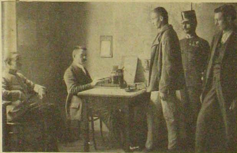
A gyanus utasokat kihallgatják.