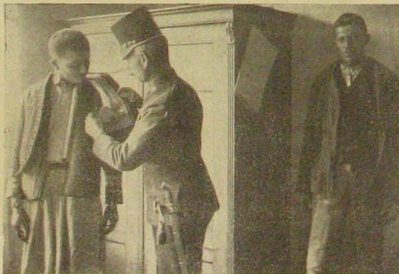
Gyanus utasok megmotozása.