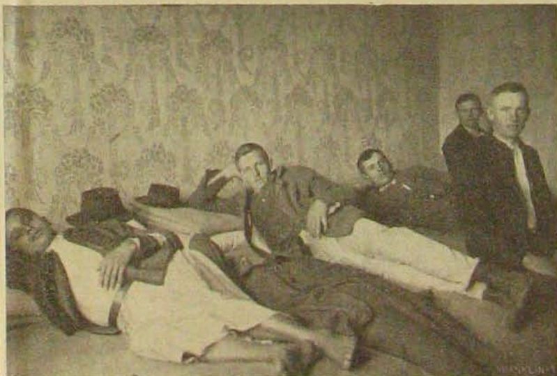
Az elítéltek fogzágbán.