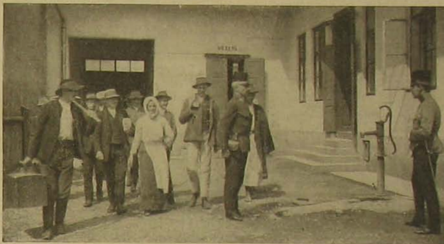
A kivándorlók ellenőrzése. — Megérkezés a határrendőrségre.