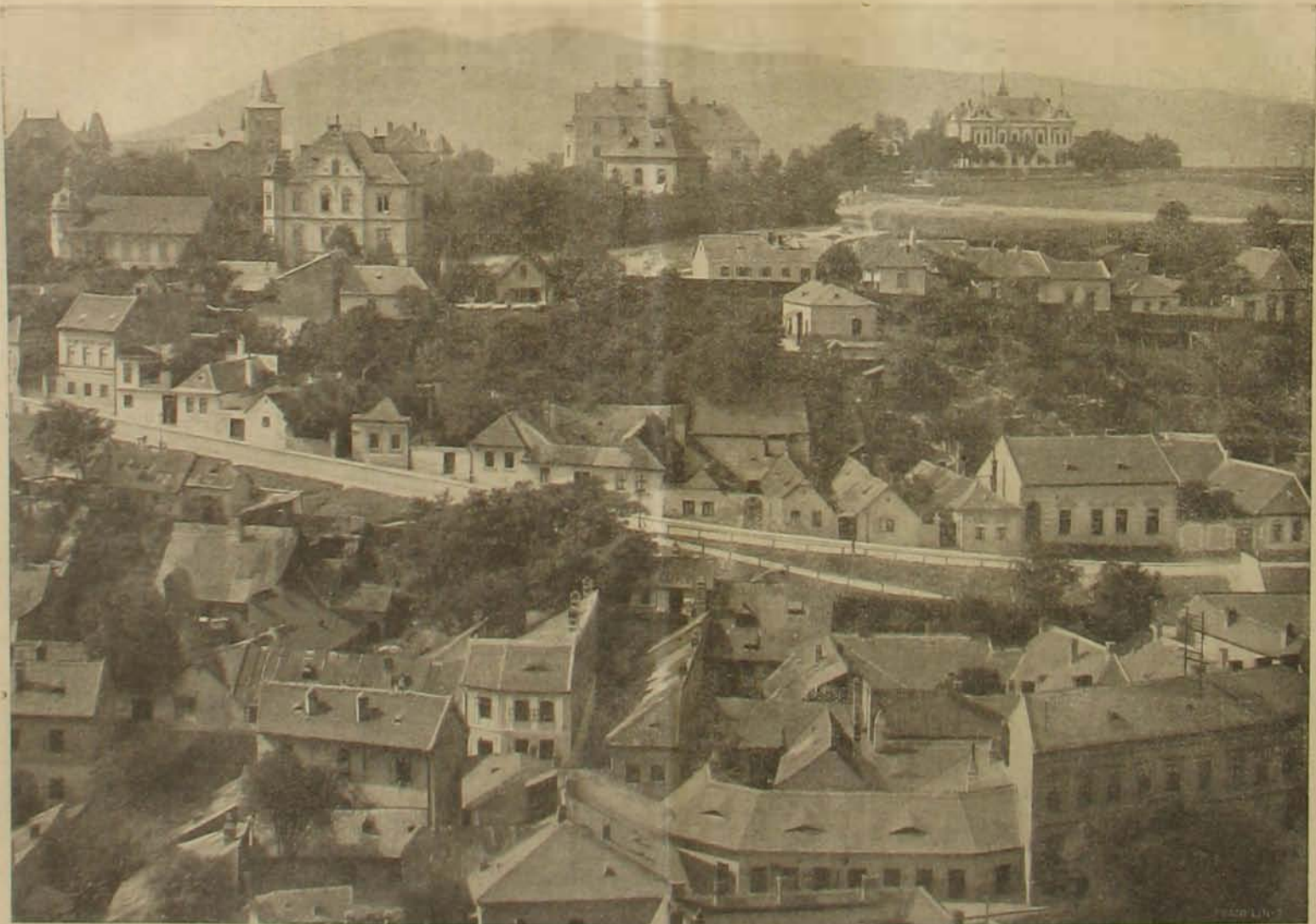
A budai királyi palota. — Kilátás a király lakosztályából a Naphogy felé.