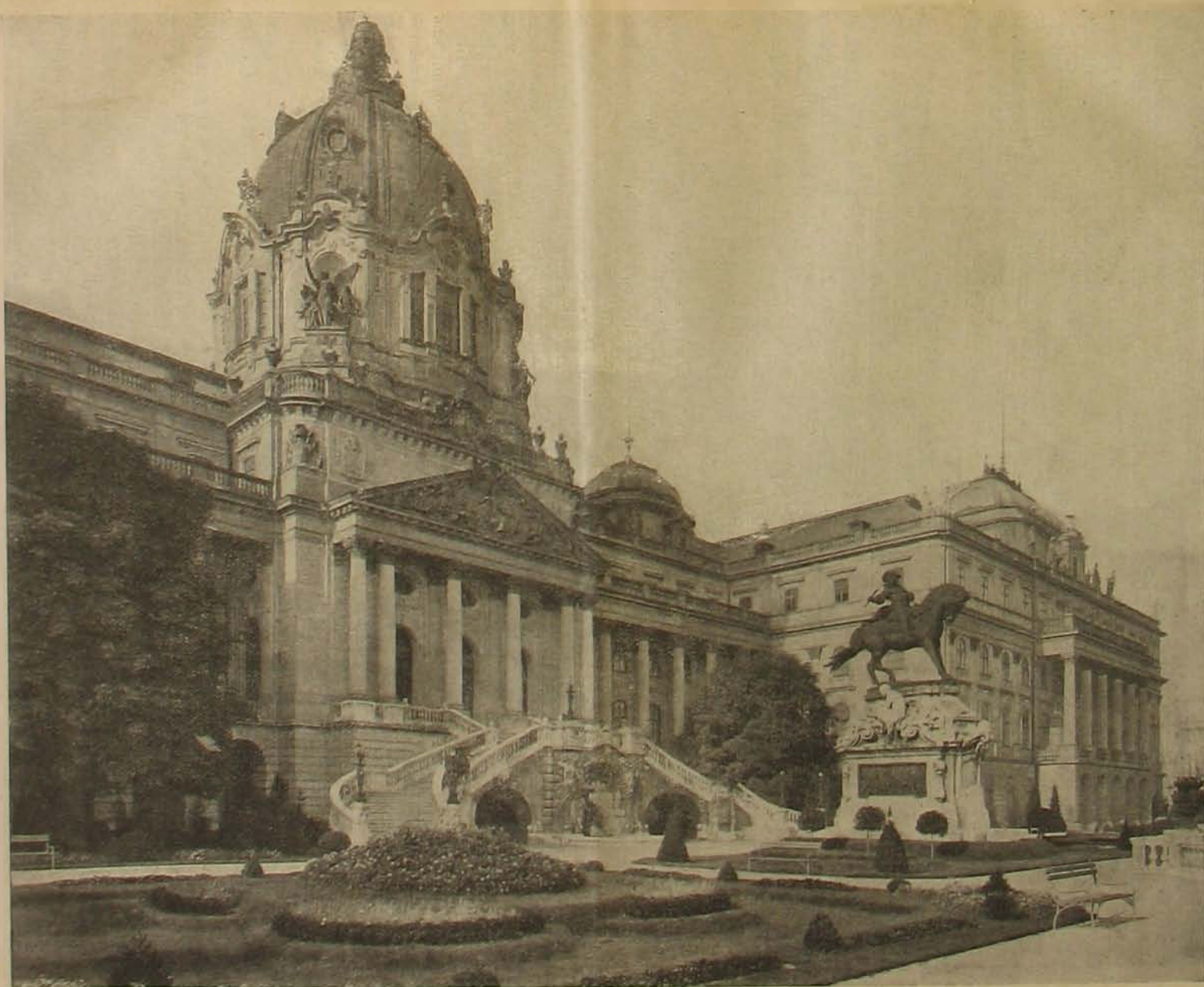
A budai királyi palota. — Főhomlokzat a Duna felől.