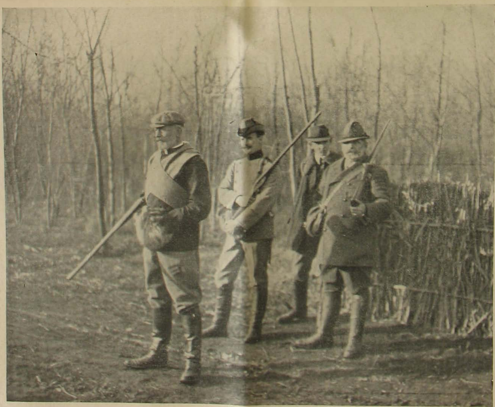
Henrik porosz herceg József főherceg kíséreti vadászatán.