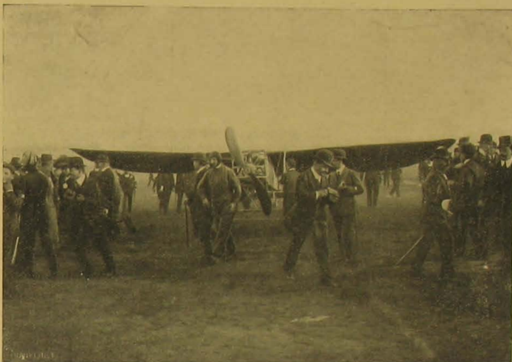
A leszállás után. (Középen Blériot).