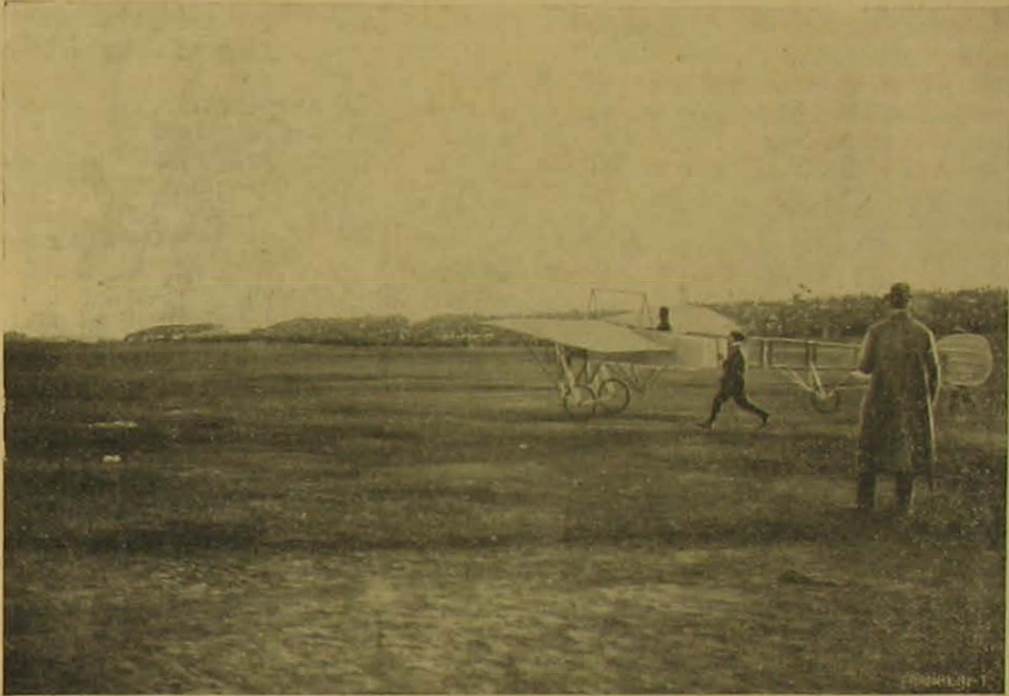
Az indítás előtt.