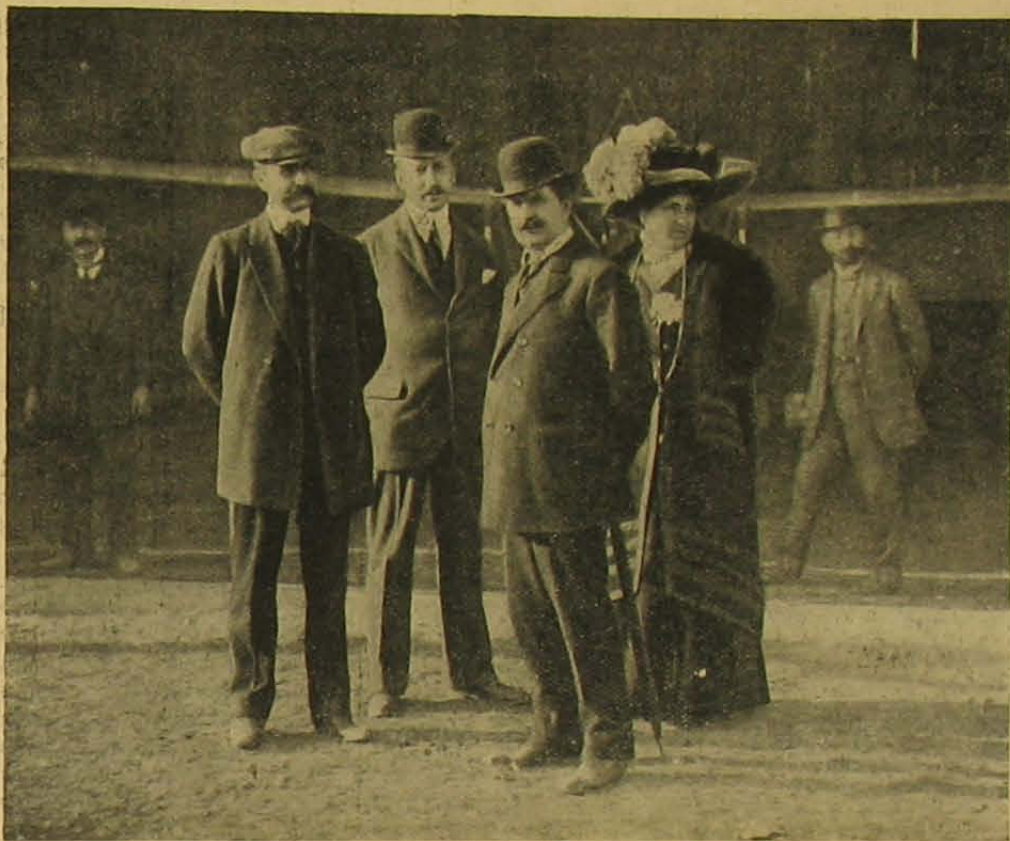
Blériot, neje és társasága.