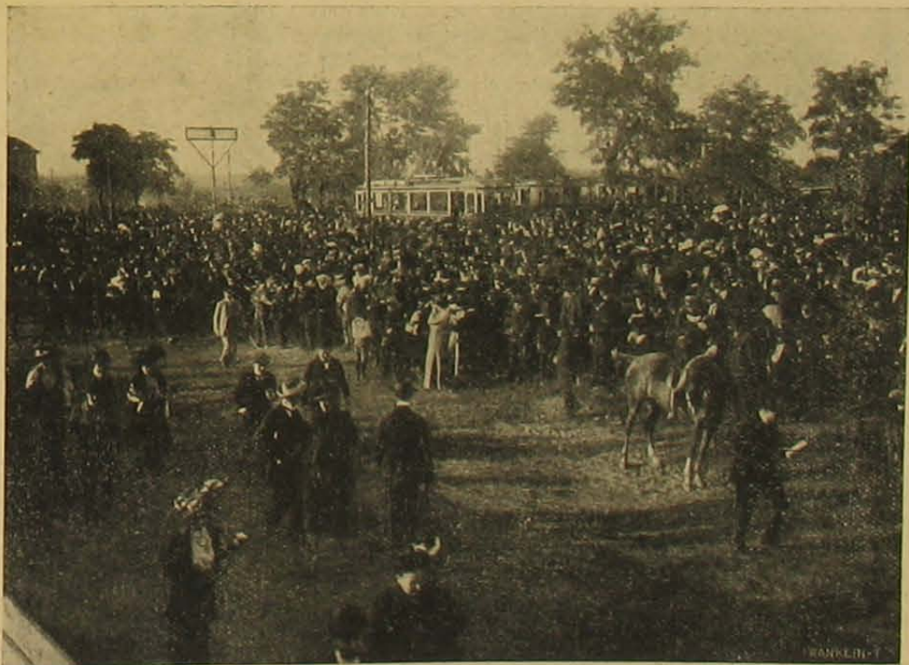
Blériot repülése Budapesten. — Ingyenes közönség.