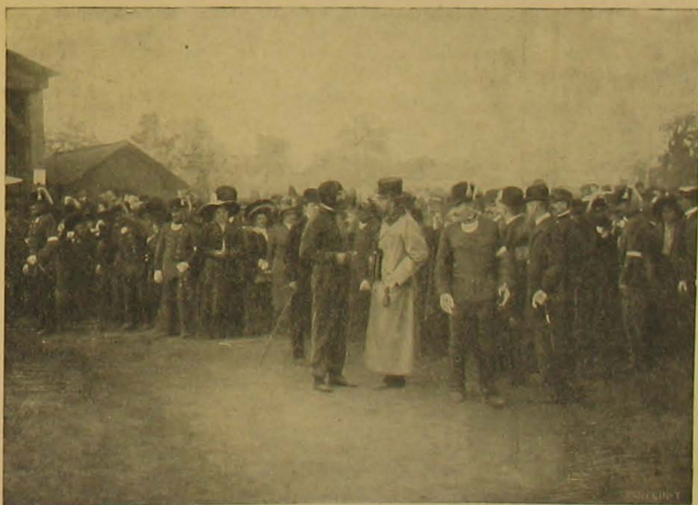
Blériot röpplése Budapesten. — József főherceg Blériotval beszélget.