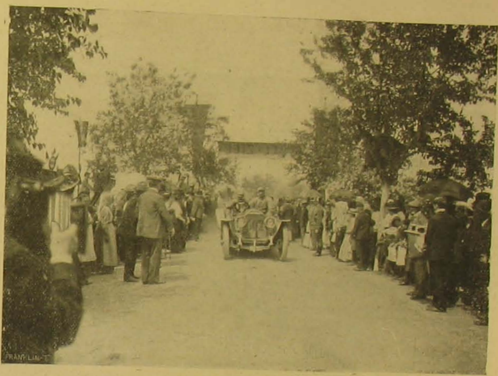
Az első automobil a megyeri czélpontnál.