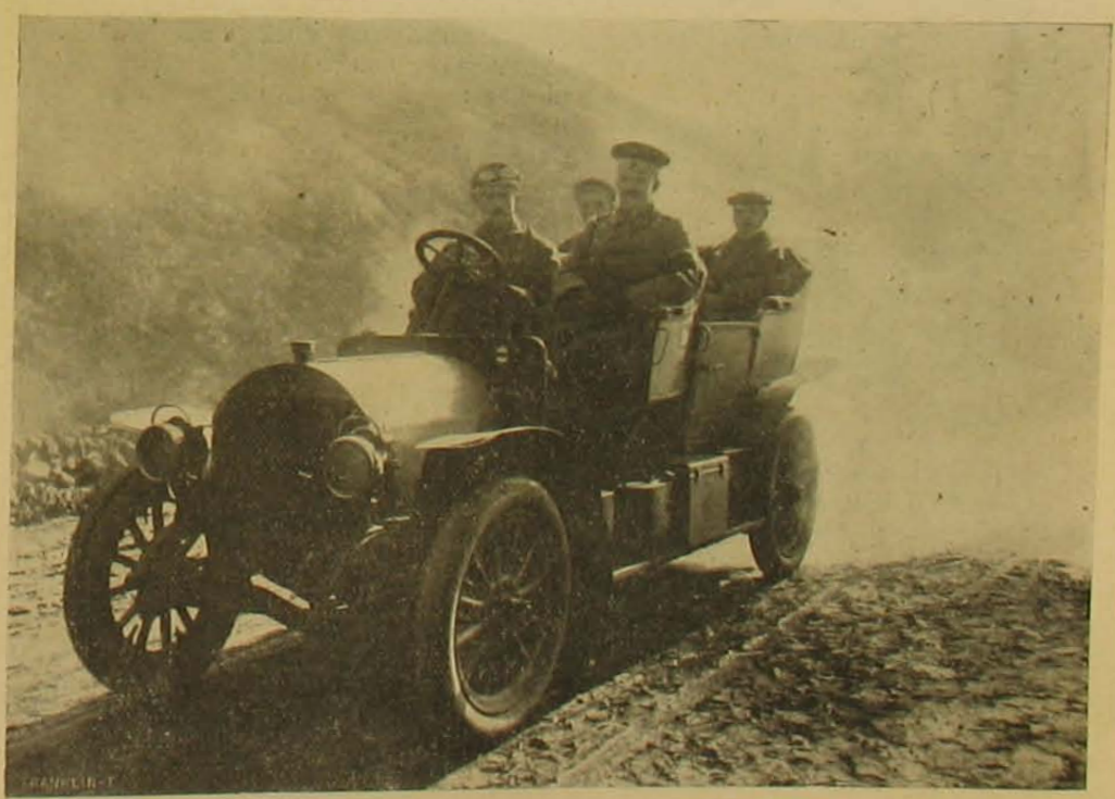
A Röck-gyár magyar készítményű gópa a Tátrában.