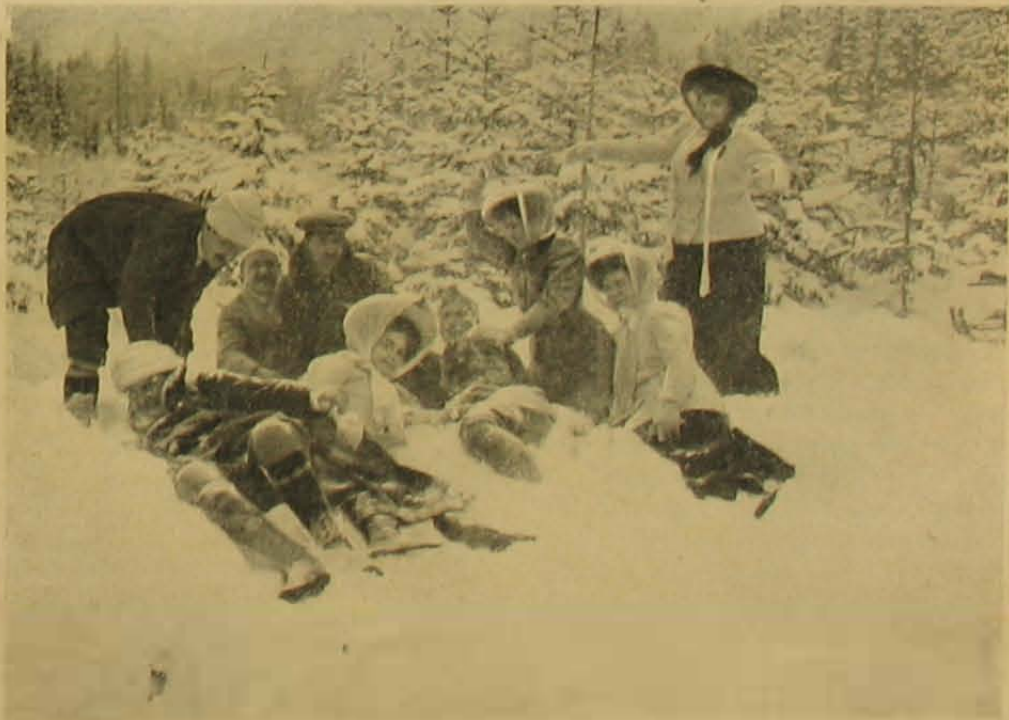
Heverészás a hóban.