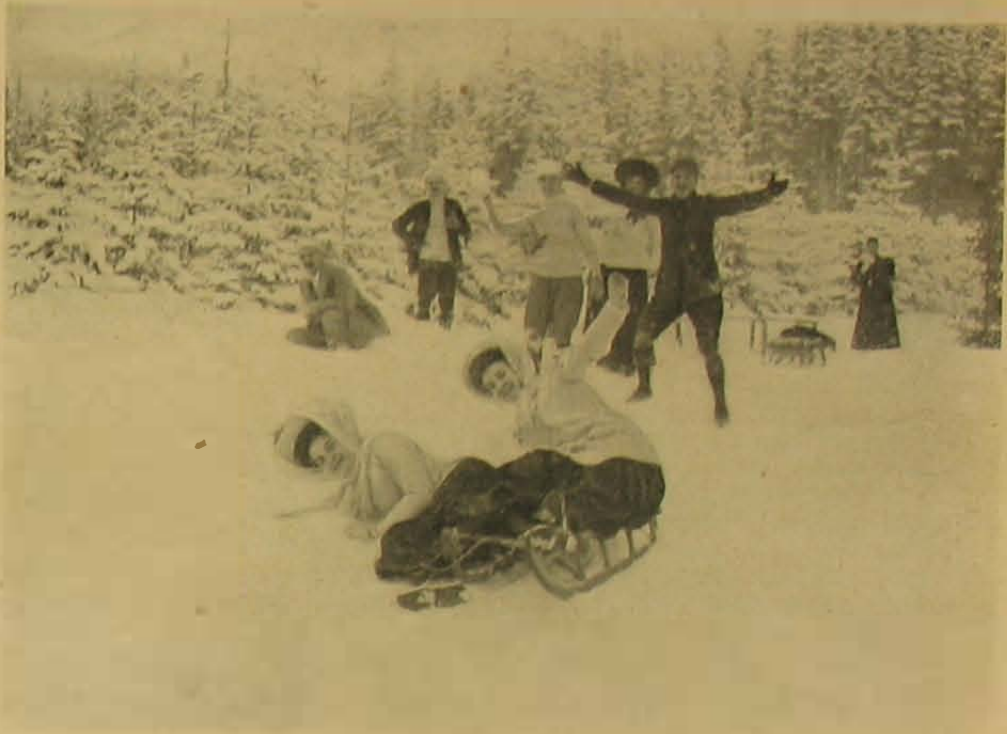
Felfordult a szán.