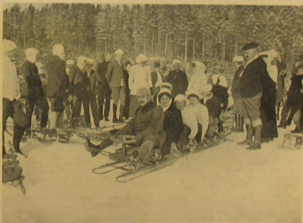
Indulás a startról.