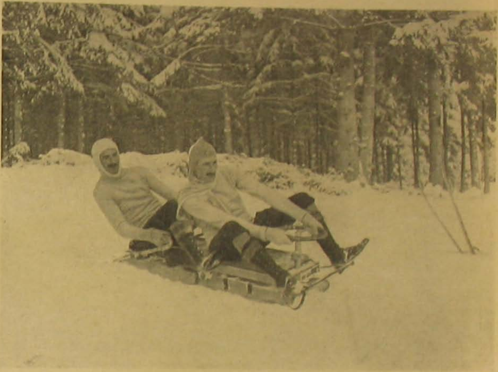
Sportolás kettős bobon.