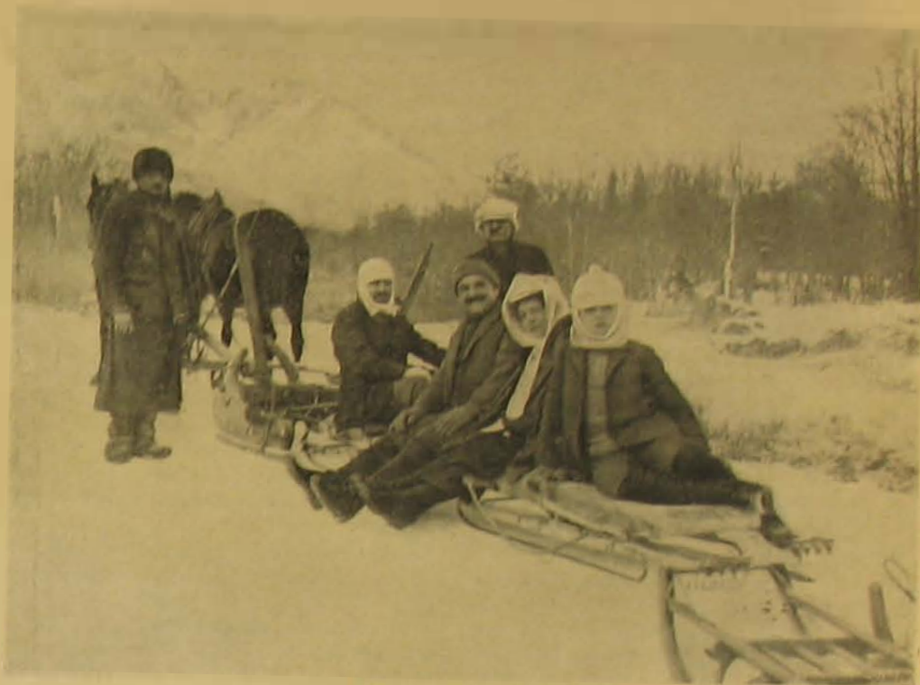
Felvontás a starthoz.