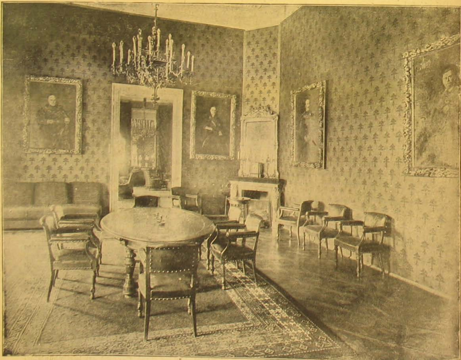
A budavári mulasztereknői palotából. — Tanács-terem.

Képes volt, hogy a gyilkosság elkövetése után új szeretőivel színházakban és más mulatóhelyeken elszórakozzon.