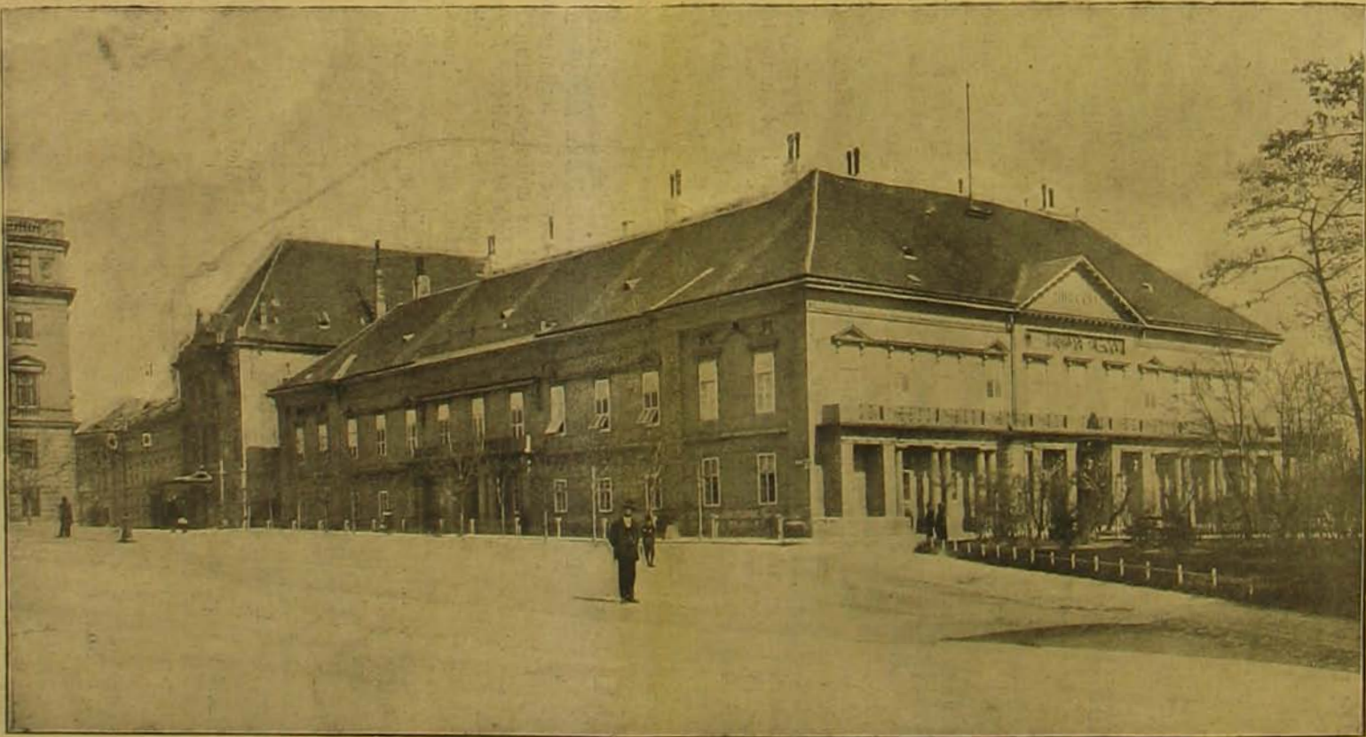
A niszterelnöki palota a Szent György-téren.