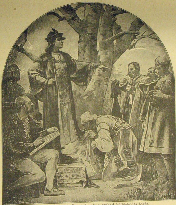
Mátyás király megadja a népnek a szabad költözködés jogát.

Azt köszöni meg a királynak, hogy megadta a népnek a költözési szabadságot.