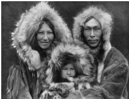
1929-ben Edward Curtis fotózta le ezt a szőrmékbe öltözött inuit családot – az elektrofónia elmélete szerint a szőrme is szükséges lehet a meteorok és sarki fények keltette hangok érzékeléséhez