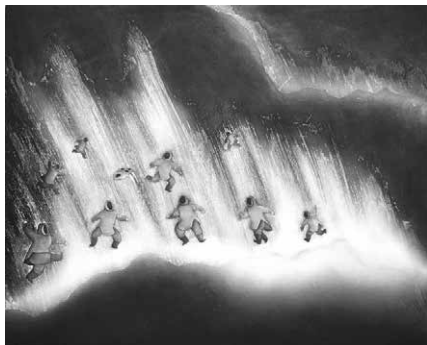
Germaine Arnaktauyok inuit festőművész alkotása a rozsmárkopynyával futballozó ősök szellemét a sarki fényben ábrázolja, a legendáknak megfelelően

A sarki fények hangjaival az északi népek – elsősorban az inuitok – legendáiban is gyakran találkozunk. Hitvilágukban a sarki fények az elhunyt ősök szellemei, a recsegő-sistergő hangok pedig azt jelzik, hogy ezen túlvilági ősök szeretnének a földi, élő emberekkel kommunikálni. Gyakorlatilag minden északi népcsoport tiltja a sarki fények idején a fűtyülést – nem szabad kicsúfolni a szellemeket, mert azok haragra gerjednek és magukkal ragadják a csúfolkodót. Grönlandi inuitok szerint a sarki fény úgy keletkezik, hogy a szellemek labdáznak egy rozsmárkopynyával – a sistergő, recsegő hangok pedig attól hallhatóak, hogy amint futkosnak labdázás közben, ropog a talpuk alatt a keményre fagyott hó. (A sarki fény, mint túlvilági labdajáték számos változatban ismert Alaszkától Grönlandig, a közös vonás bennük az, hogy a holtak szellemei részt vesznek a játékban).