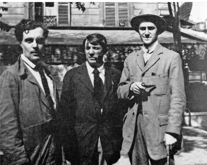
Amadeo Modigliani, Pablo Picasso és André Salmon a Café de la Rotonde előtt. A fénykép 3:30 körül készült

12-e a helyes időpont. Klüver azután képről képre megállapította, hol, merre járt Picasso baráti társaságával.