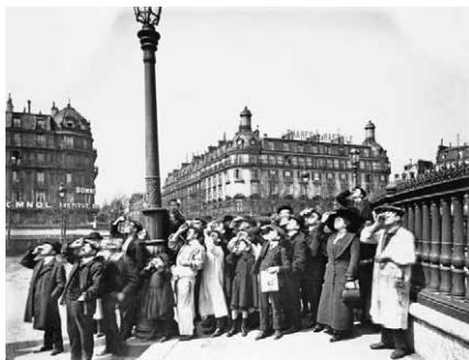
Párizsiak az 1912. április 17-i napfogyatkozást figyelik Eugène Atget felvételén

kutatták és kutatják ma is. A kutatók egyike volt Billy Klüver (1927–2004), aki a számunkra legerdekesebb módon közelítette meg Picasso egy napját, 1916. augusztus 12-ét – 29 fényképfelvétel alapján. A képek zömére 1978-ban bukkant, miközben a párizsi Montparnasse művészeiről keresett dokumentum jellegű fotókat. A felvételek többsége a párizsi utcákon készült, és az egyik fotó háttérében álló épületek jól látható árnyékvetése adta az ötletet: talán meg lehetne