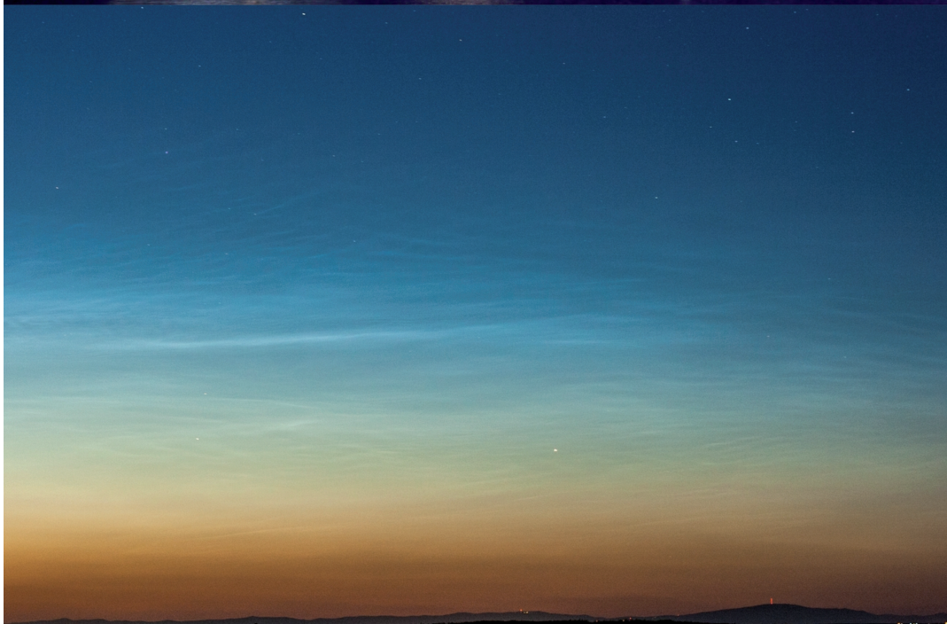
Szabó Szabolcs Zsolt július 10-i felvétele éjszakai világító felhőkről. A Mátra fölött jól látható az alsó delelésben levő Capella