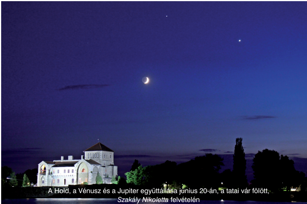
A Hold, a Vénusz és a Jupiter együttállása június 20-án, a tatai vár fölött