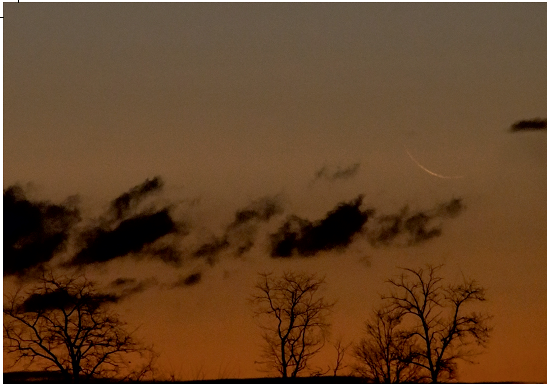
19,5 óra korú holdsarló 2014. december 21-e hajnalán, Kaposmérő határából