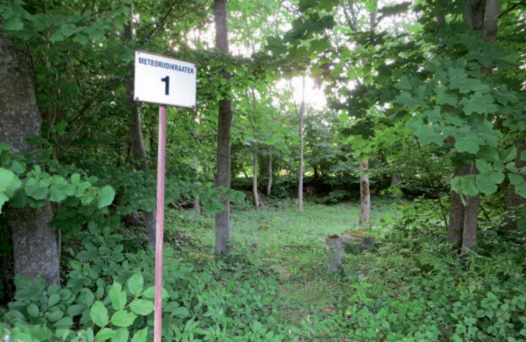
Meteoritkárterek Észtországban. Az 1-es számú kráter a Kaali-meteoritkrátermezőn (fent) és a 80 méter átmérőjű Põrghaud-kráter (lent) – lásd cikkünket a 4–9. oldalon!