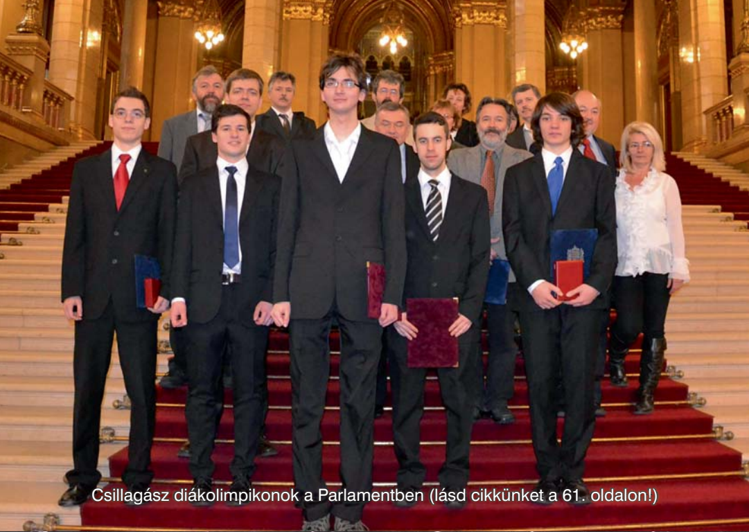
Csillagász diákolimpikonok a Parlamentben (lásd cikkünket a 61. oldalon!)