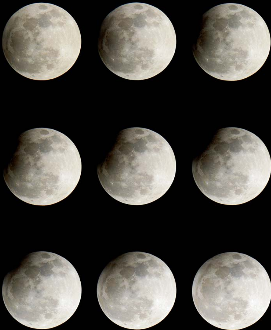
Szabó Ádám sorozatfelvétele az április 25-i részleges holdfogyatkozásról. 150/750-es Newton-távcső, Nikon D5100-as fényképezőgép, 1/400 s-os expozíciók ISO 200 érzékenység mellett