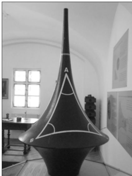
A két Bolyai hiperboloidja – részlet a Telesi Téka épületében látható kiállításból

A homlokzat és az előcsarnok tervezése Körösfői-Kriesch Aladár munkája. A freskók erdélyi és magyar témákat dolgoznak fel, s a korabeli napi politikának épp úgy helye van itt, mint a mondavilágnak, az egyszerű székely embereknek és I. Ferenc József császárnak és királynak. Az épület csillagászati látványossága a híres Tükörteremhez köthe-