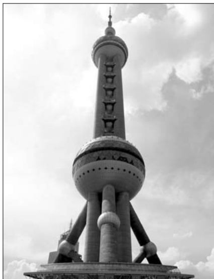
Részlet a modern Shanghajból

Megérkeztünk azonnal belevetettük magunkat a városi életbe – minden percet ki kell használni, hogy megismerjük az ottani életet. Az utak sokemeletesek, sokszávosak. A motorok, riksák, biciklik saját sávjukban közlekednek. Nincsenek forgalomirányító lámpák, hatalmas káosz van az utakon, éjjel nem gond lámpa nélkül vezetni, sokat dudálni, nyomakodni és előzni – ennek ellenére egyetlen egy koccanást vagy balesetet sem láttunk az utakon.