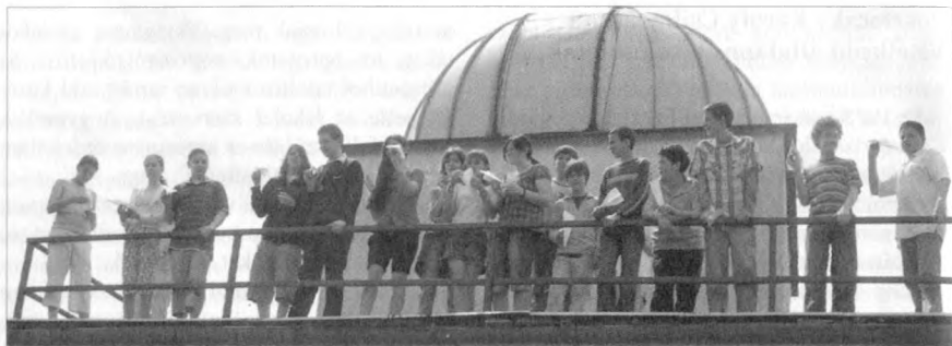
A „Mars-űrjárok” célba juttatása volt az egyik legizgalmasabb feladat (bővebben l. a cikkben)

Személyesen vittük ki minden iskolába a versenyfelhívást és az első írásbeli forduló csillagászati totóját, amely kitöltésével lehetett nevezni. A nevezési határidő utáni első keddi napon a csillagdában mindenkit meglepett, hogy a kb. 500 gyermek közül 156-an (!) neveztek a versenyre három fős csapatokban. Ilyen sikerre senki sem gondolt.