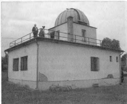
A csillagda épülete mára igencsak megérett a felújításra