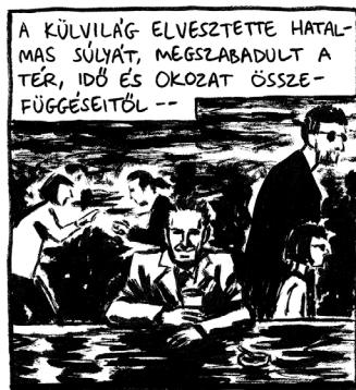
KONCEPCIÓ: HUDRA MÓNI • RAJZ: ORAVECZ GERGŐ