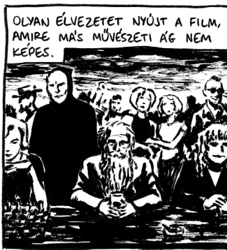
Szöveg: Hugo Münsterberg: A film. Pszichológiai tanulmány