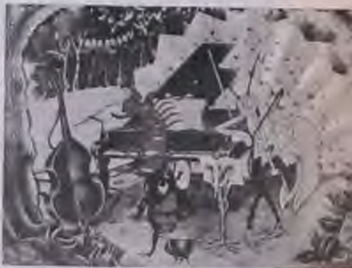
Halas-Batchelor: Pillangók bálja

— Pontosan nehéz megmondani. De kiszámíthatja, hogy az avantgarde filmeknek — tehát, amelyek nem igénylik a közönség aktív részvételét és munkáját — a jó vagy rossz értelemben vett kommersz filmekéhez képest csak öt százaléknyi a közönsége. Ezek tehát egyértelműen veszteségesek. A stúdiók gaz-