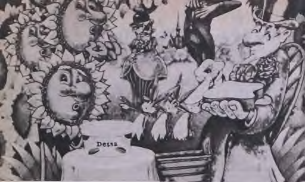
Filmkocka a Dessa-margarin reklámjából