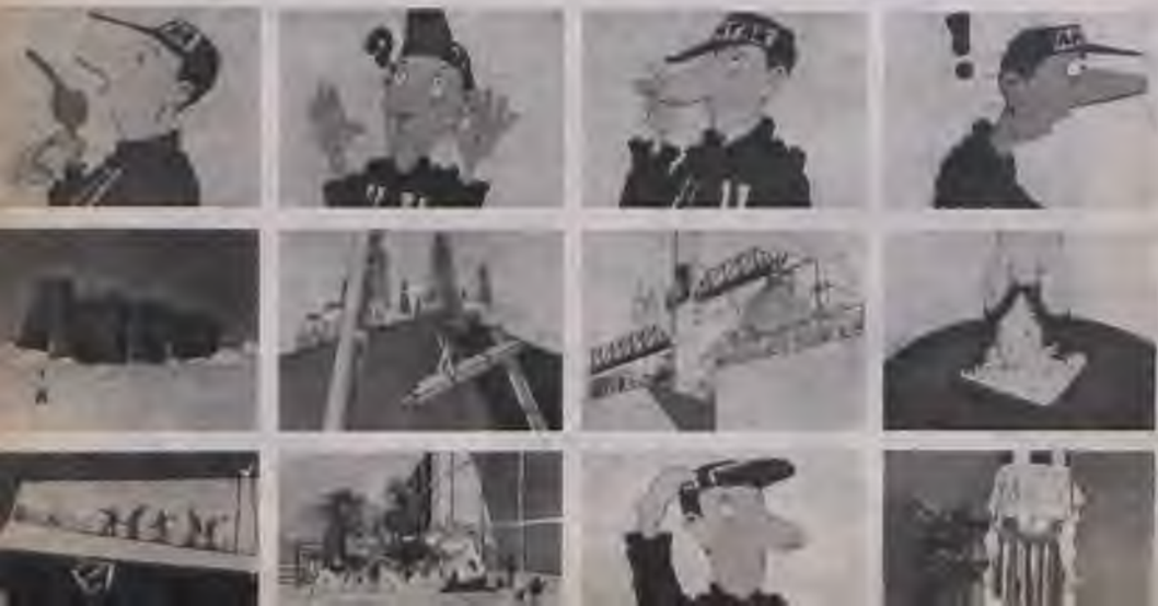
Képkockák az Antar-kőolajtársaság reklámjából