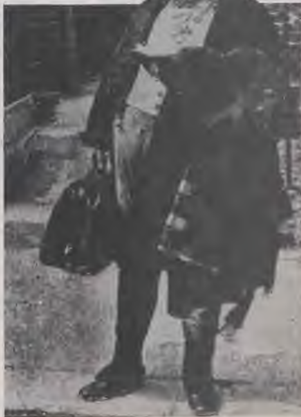
John Bunny a Pickwick Paper 's című filmben

Az előző, ötödik évad mágikus záróestje után Carl Davis, aki a napokban még Londonban vezényelte legújabb, a The General című filmhez komponált zenedarabját, jelenleg pedig a Ben Hur partitúráján dolgozik, visszatért, hogy a fesztivál záróakkordjaként egy újabb élő-mozi koncerttel ismét nagyszerű záróél-