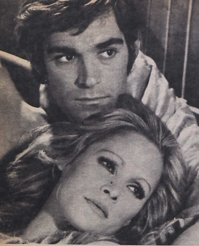
Ursula Andress és Fabio Testi — Maurizio Lucidi: Az utolsó esély című filmjének főszereplői

mi kapcsolatok fűznek egyik kolleganőjéhez (Adriana Asti) és egy kiugrott papnövendékhez (Lino Capolicchio).