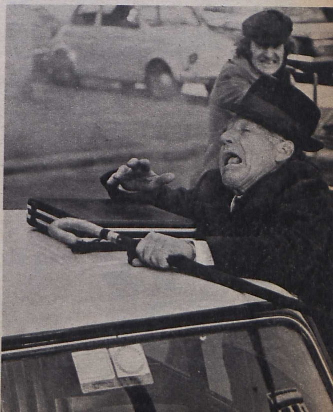
James Withmore az Egy rendőrfelügyelő halála című film főszerepében

ző a történetet fikatív környezetbe ültette át. A cselekmény Genová-ban játszódik, a kábító-szercsempész business világában. Ezzel éleste-lenítette a bonyodalom közvetlen politikai vo-natkozásait. Bizonyos mértékben erre kénysze-rítette a valóság is: a körülmények, a tettesek és megbízók máig ismeretlenségnek. Plasztikusan domborodik ki azonban a filmből egy lényeges mozzanat. Szoros és át-tekintethetetlen szöve-vényben áll az olasz közélet az alvilággal, egyes hatalmasságok