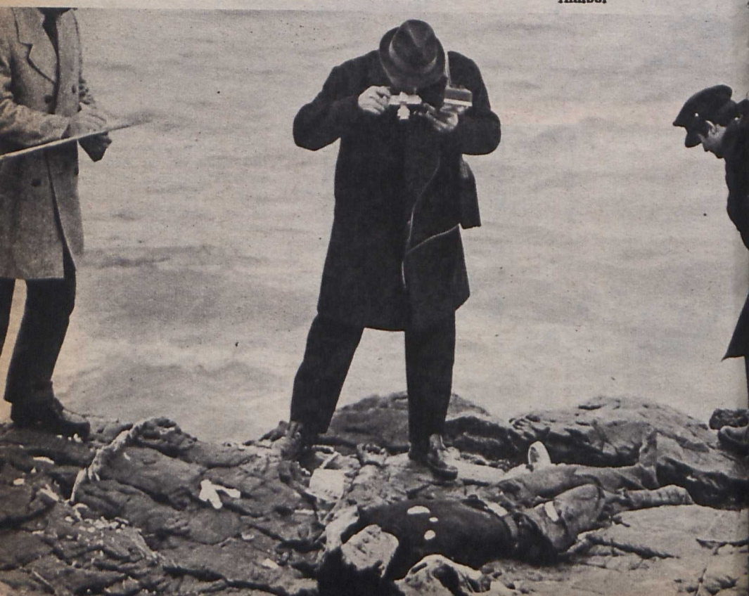
Jelenet az Egy rendőrfelügyelő halála című filmből