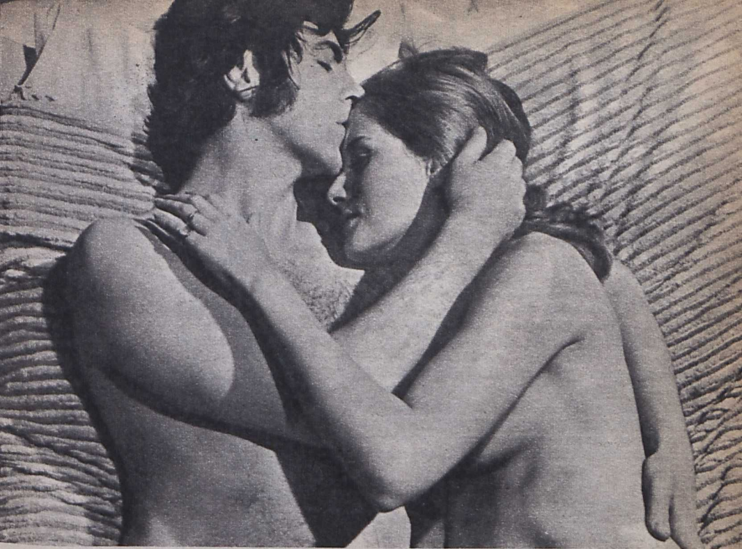
Alan Bates és Dominique Sanda a Lehetetlen dolog című filmben