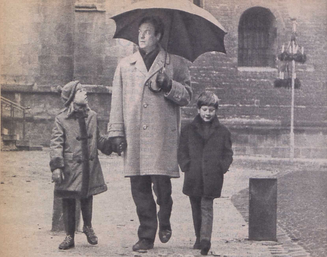
Jelenet a Minden évben újra című film- ből. Rendező: Ulrich Schamoni