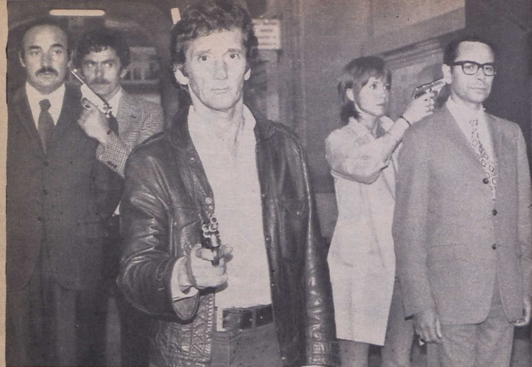
Edouard Molinaro: A túsok bandája

és a saját hűgával szerelmeskedik. A zsaruk közbeavatkozása ellenére a szomszédok megértik, hogy Thermoc-nak van igaza, maguk is barlanggá alakítják át otthonukat és hátat fordítanak a világnak.