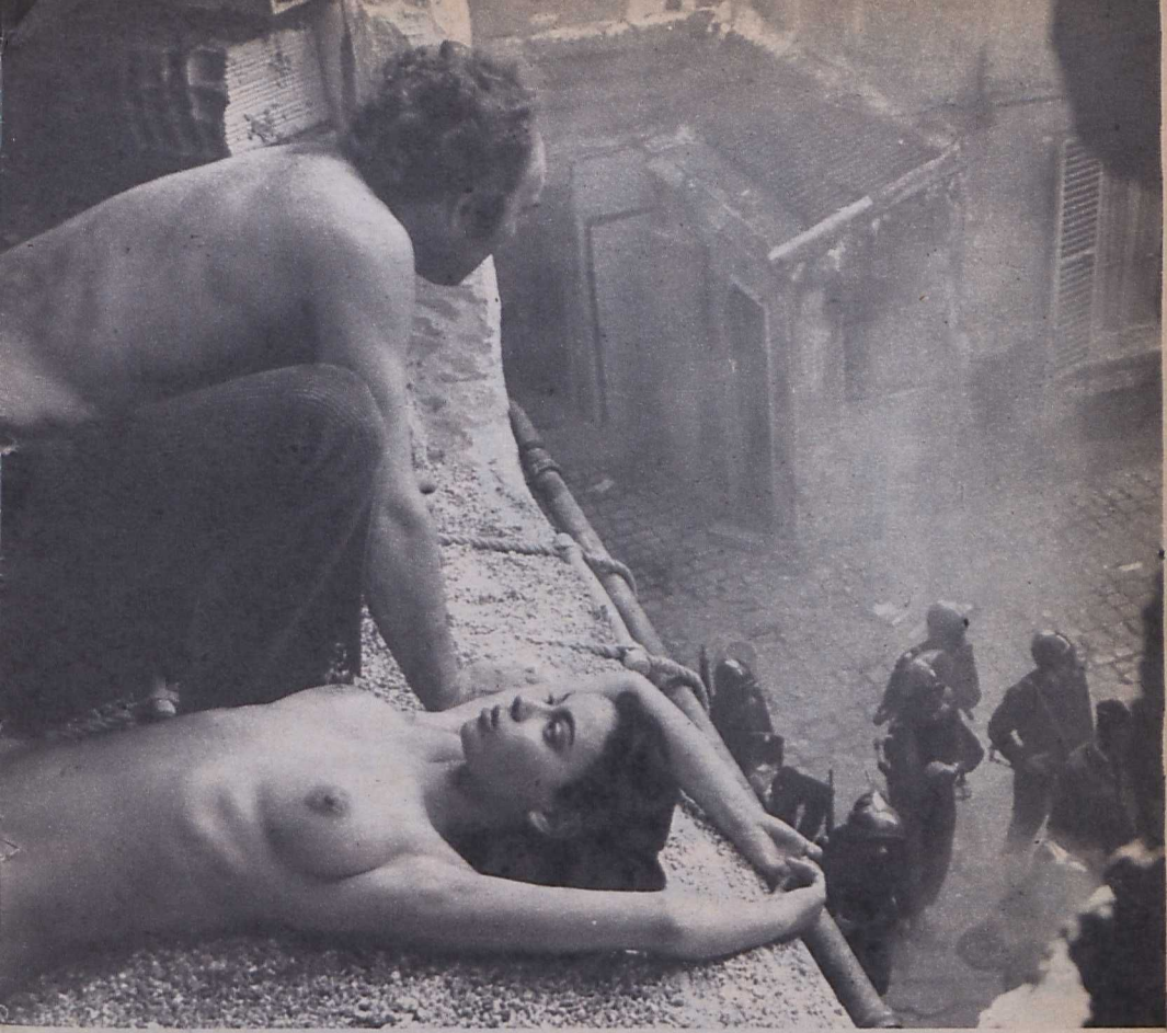
Jelenet Claude Faraldo: Themroc című filmjéből