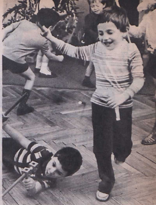
Paulus Alajos: Kiskarácsony, nagy- karácsony

Valamit a fesztivál hangulatáról. Már említettük, hogy a nézőteret el- sősorban a fiatalok népesítették be: a helyi és a környező városokbeli tí- zenhat-huszonötévesek, akik a vetí- tések közötti szünetekben lázas vi- tákat rendeztek, nem is elsősorban a látott filmekről, inkább, azok ürü-