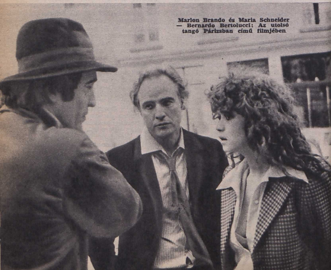
Marlon Brando és Maria Schneider — Bernardo Bertolucci: Az utolsó tangó Párizsban című filmjében

Ami magát a művet illeti, alkotója az ifjabb olasz rendezői nemzedéknek kétségtelenül egyik legtehetségesebb tagja. Bernardo Bertolucci világhíre Moravia regényének, A megalkuvónak megfilmesítésével tett szert. Marlon Brando is ennek ismeretében vállalta Az utolsó tangó Párizsban férfi