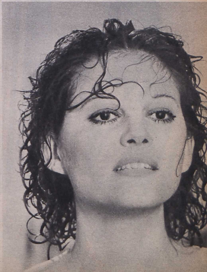
Claudia Cardinale — Mauro Bolognini: Szerelmem, Libera című filmjének főszerepében

Bertolucci hívei közül is többen kifogásolják esztétikai szempontból egyes jelenetek erőltetett, kihívó naturalizmu-