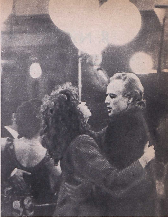
Maria Schneider és Marion Brando Az utolsó tangó Párizsban című film egyik jelenetében

cáinak életéről számol be. A rendkívüli értékű kézirat jelentősége nem abban rejlik, hogy vázolja a kényszerű özszezárttság következtében fellépő fizikai és pszichikai eltorzulásokat. A krónika pontosan tükrözi azokat a társadalmi kényszerűségeket, amelyek a különböző osztályokból származó fiatal nőket zárdái életre ítélték. Kultúrpolitikai és irodalmi értékére jellemző, hogy a későbbiekben olyan elmék figyeltek fel a kéziratra, mint Stendhal és Benedetto Croce. Stendhal egyenesen kijelen-