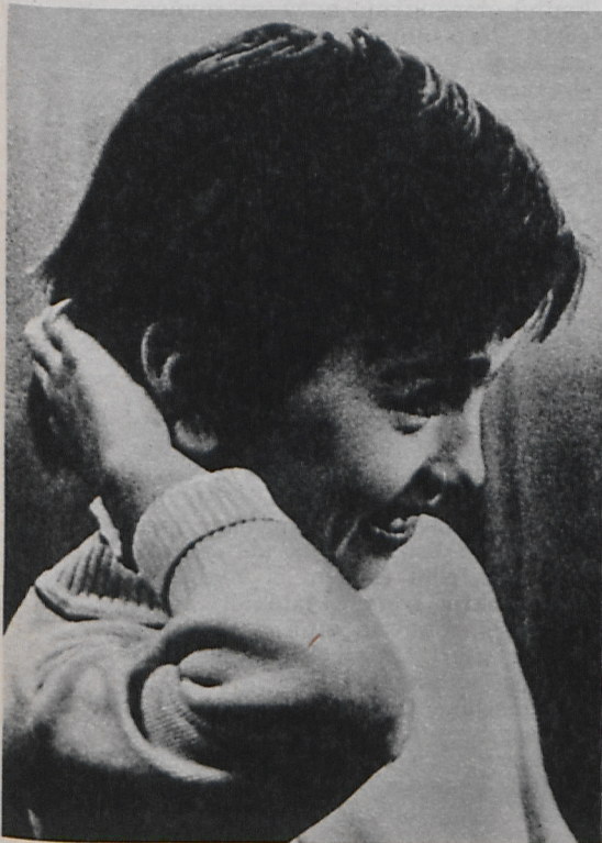
Két portré az Otthon című filmből

A rendező-operatőr, Dobray György — ez már az első kórházi képeknél szembe ötlük — rendkívül érzékeny; úgy látszik, szerencsés eset az, amikor a rendező kezeli a felvevőgépet, így azonnal követni tudja gondolatainak villanását, egyetlen idegpályán fut végig min- den érzelmi rezdülés. A beteg gyer- mekek látványa óhatatlanul meg- rendítő, éppen ezért — praktikus szempontból nézve — e látvány rö- gzítése hálás feladat, már önmagá- ban is kifizetődő lehet. De ponton- osan ez az érzelmeket csiholó légkör rejtja a legnagyobb veszélyt: az ér-