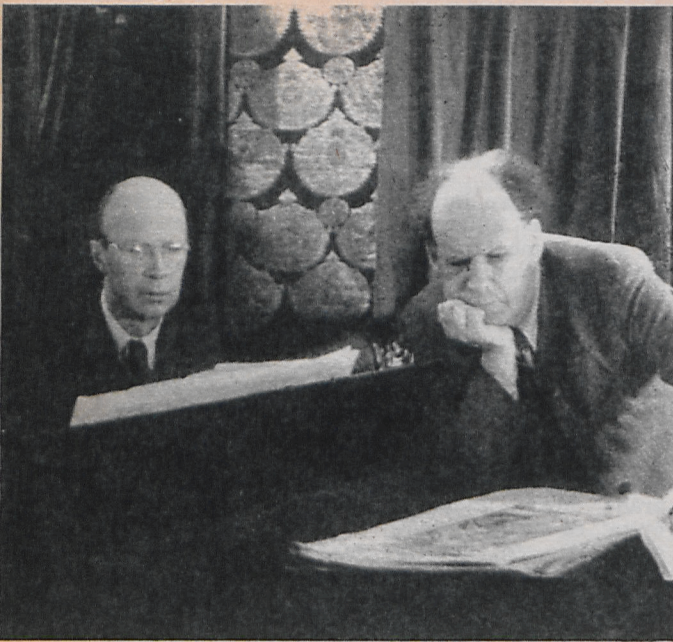
Prokofjev és Eizenstein 1944-ben

sét üdvözlő; Mark Donszkoj a rá annyira jellemző széles gesztusokkal magyarul. Az emlékünnepe első mozzanata: Rosalj megnyitja az érdekes dokumentumokból összemontírozott kiállítást, melynek sokszínűségét és változatosságát nehéz szavakkal érzékeltetni. Munkafotók tömege. Eizenstein a kamera mögött. Felvételek a próbákról. Színek, vonalak, harmóniák a papíron. Találkozások ott-hon és külföldön. Eizenstein a katedrán. Intim pillanatok és a nyilvánosság előtti szereplés beszédes fotográfiái. A kiállításról mindenki a hatalmas vetítőbe siet: a mosolygó Eizenstein fényképe alatt Szergej Jutkevicz egymás után adja meg a szót az emlékezőknek. Sklovszkij a „soha nem feladni” eizensteini következetességet hangsúlyozza, mint meghatározó jelen-