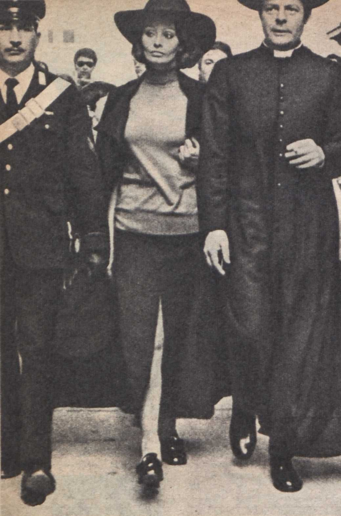
Sophia Loren és Marcello Mastroianni Páduában forgatják Dino Risi, A pap felesége című filmjét.