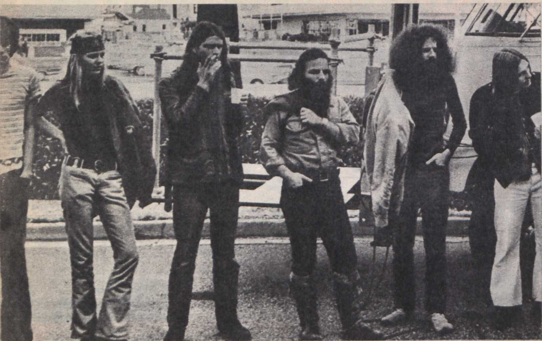
Jelenet Michelangelo Antonioni:

marihuánát szívják és a kábítószer-ek élvezetét az emberi felszabadulás egyik lehetséges állomásának tartják.