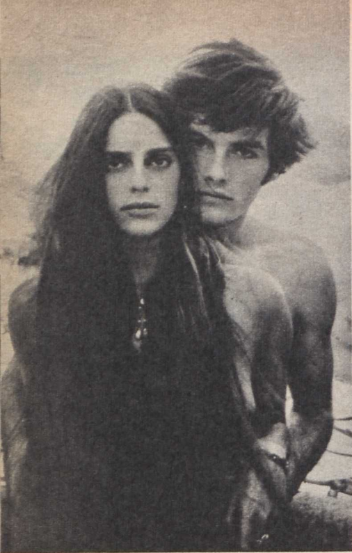
Daria Halprin és Mark Frechette, a Zabriskie Point főszereplői

szerre megtelik szeretkező párokkal, hőseink boldogsága kozmikus méretűvé nő. Úgy érzik, elérték azt a teljességet, amit fiatal életükben eddig hiába kerestek. Egész együttlétük alatt egyetlen vitájuk van. A lány nem tud egyetérteni a fiú forradalmat akaró elszántságával. Hazaindulás előtt játékos hangulatban a gépet bepingálják színes hippy mintákkal, majd a fiú felszáll. A lány a kocsiján megy hazafelé. Bekapcsolja a rádiót és meghallja, hogy szerelmét, aki percek alatt visszaért, a Los Angeles-i repülőtéren a rendőrök mint repülőgéprablót agyonlőtték. A lány első kétségbeesésében apjához megy, de rájön, hogy hiába, hiszen aligha tudná megértetni, mi minden történt vele ma, mit vesztett ő ebben a fiúban.