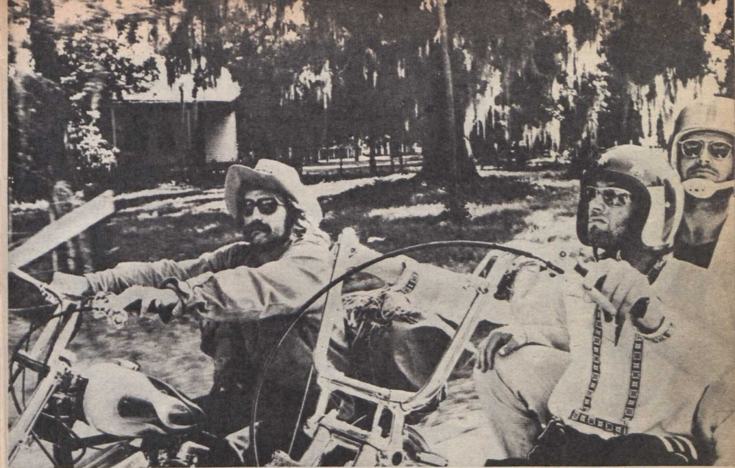
Dennis Hopper, Peter Fonda és Jack Nicholson — Dennis Hopper: Szelíd motoros című filmjének főszereplői

Az első film, az Éjjeli cowboy hőse gazdag nőkkel, sőt szorult helyzet esetén akár férfiakkal szeretné eltatni magát. Ez a buta szépfüú a legnagyobb éhezés idején sem gondol arra, hogy esetleg munka árán jusor keresethez. Joe Buck, (John Voight játssza) azért hagyta ott a tányérmosogatóst Texasban, mert megunta, hogy mások kihasználják, hogy csupán egy ismétlődő, unalmas munkafolyamat része. Azt gondolta, ha felmegy a világvárosba, végre a maga életét élheti. Persze nem várták csinos, gzdag, szerelemre sóvár asszonyok. Eddig csak a munkaerejét adta el, most pedig önmagát adja el. Nincs senki a nagyvárosban, aki az életét hozzá akarná kapcsolni. Az egyetlen társ, egy sánta, mocskos olasz tolvaj, akivel egy lebontásra ítélt ház fűtetlen szobáiban osztotta meg anyagi és érzelmi nyomorúságát, meghal tüdőgyulladásban.