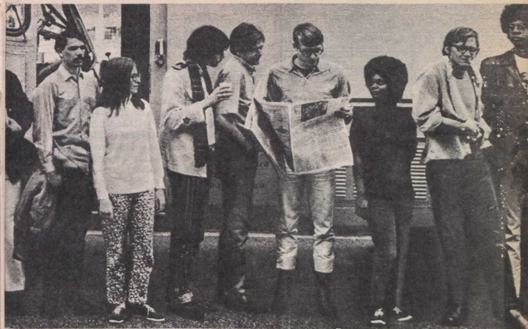
Zabriskie Point című alkotásából

nem tudja ugyan eltakarni a hippí lét hosszú távon céltalan és üres voltát, de azzal a szeretettel, mellyel a mai harmincon aluliak nyílt, előítélet mentes, szabad gondolkodását, mások iránti türelmét és szelídségét bemutatja, fiatal nézők millióit nyerte meg magának. Sikeréhez hozzájárulnak az ihletett, emlékezetes beat számok is, amelyek a hosszú vándorút vadregényes tájain éppúgy felcsendülnek, mint a családások, bánatok vagy az idilli rövidségű örömtől közepette. Ebben a kevésbé szédű filmben a zene hordozza az érzelmeket. És persze a képek, melyek a külföldön élő Kovács László meglepően újszerű és sokszor megrendítően szép operatőri munkáját dicsérik.