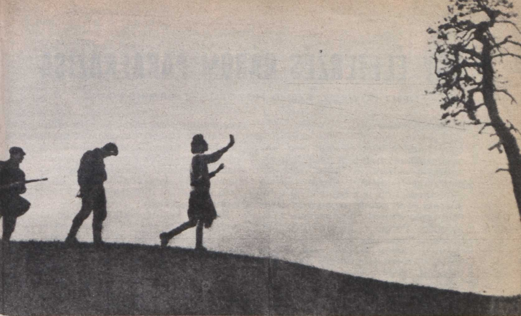
Jelenet A törvény nevében című filmből