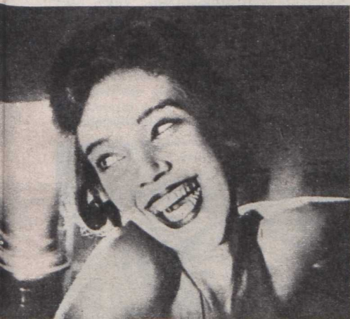
A Mr. West kalandjai a bolsevikok országában című film egyik jelenete

Túl korán indult és mégis elkésett. Eizenstein, Poduvkin, Dovzszenko nevét visszhangozta a világ, és Kulesovnak meg kellett elégednie azzal, hogy 1929-ben megjelent Filmművészet című könyvének előszavában így bókoltak a hálás tanítványok: „Mi filmeket csináltunk — ő filmművészetet teremtett!”