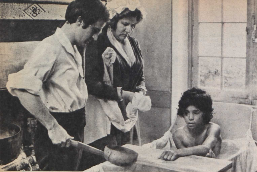
François Truffaut, Françoise Seigner és Jean-Pierre Cargol A vad gyerek című Truffaut-film főszereplői

Boyertól Michèle Morga- nig és Gaby Morlaytól Jean Maraisig, aki ne szerepelt volna művei- ben. Fernandelt és Rai- mut ő fedezte fel a film számára. Az utóbbi esz- tendőkből már csak a fiatalok nevelésével fog- lalkozott, és most ellen- állhatatlan belső ösz-