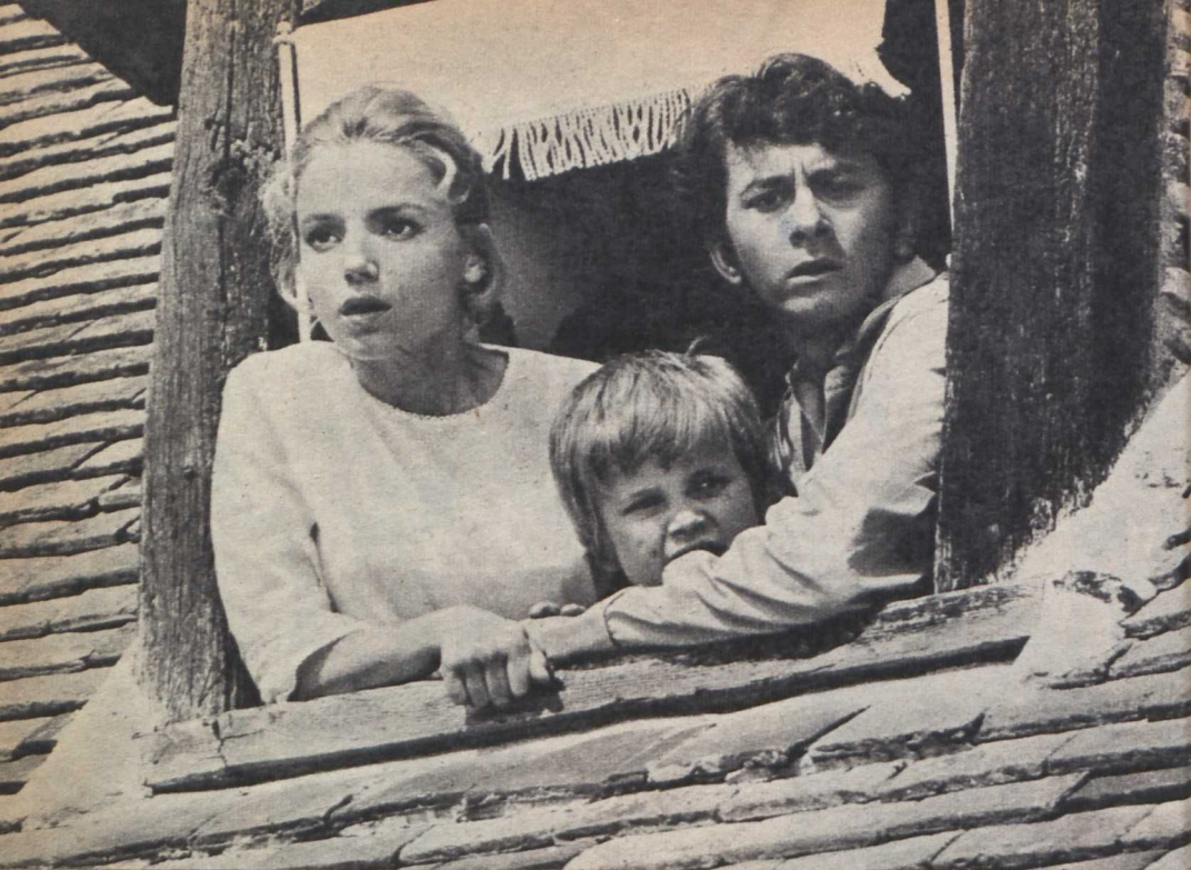
Jelenet Jan Girault: Vidéki ház című filmjéből