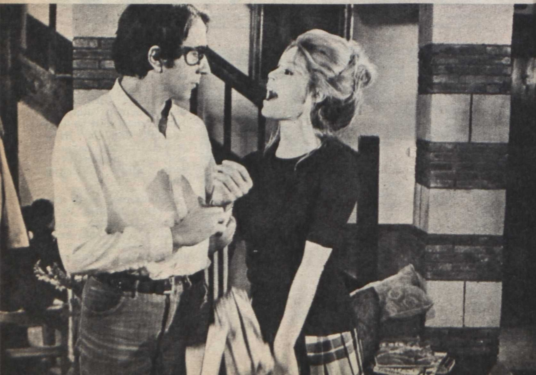
▽ Jean-Pierre Cassel és Brigitte Bardot A medve és a baba című Michel Deville-film főszereplői