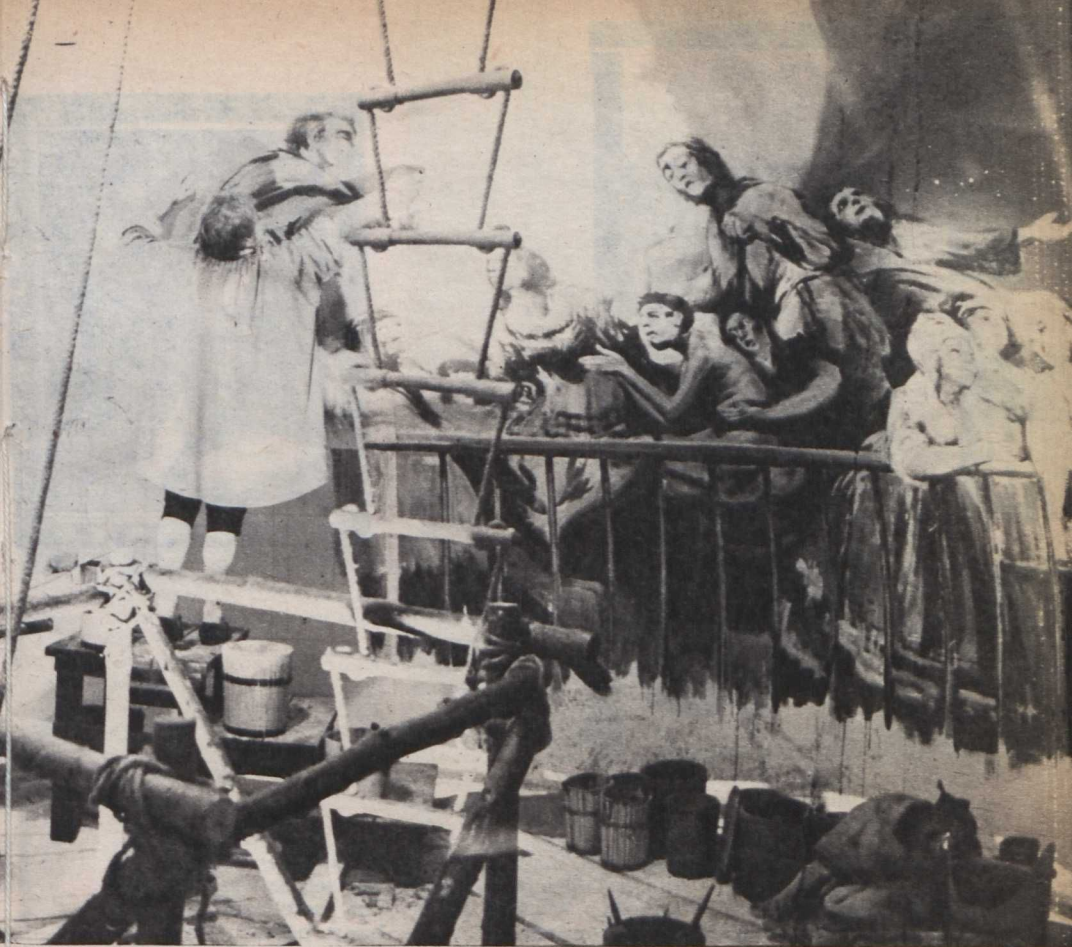
Goya freskón dolgozik

venmilliméteres, színes filmünket két részesre tervezzük.