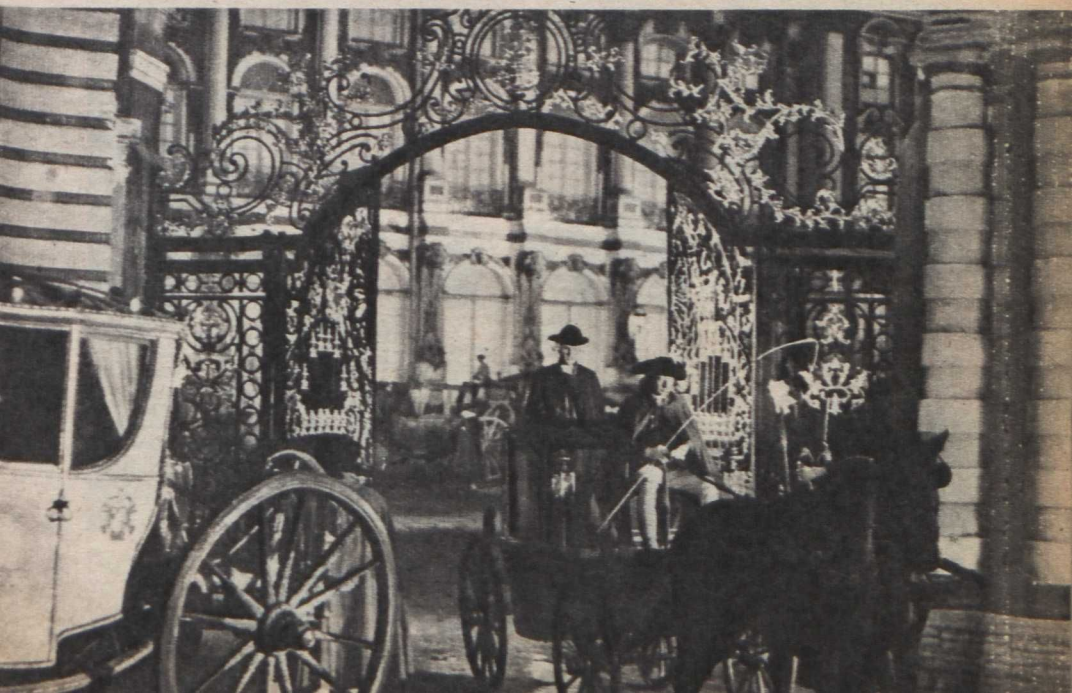
Jelenet a filmből