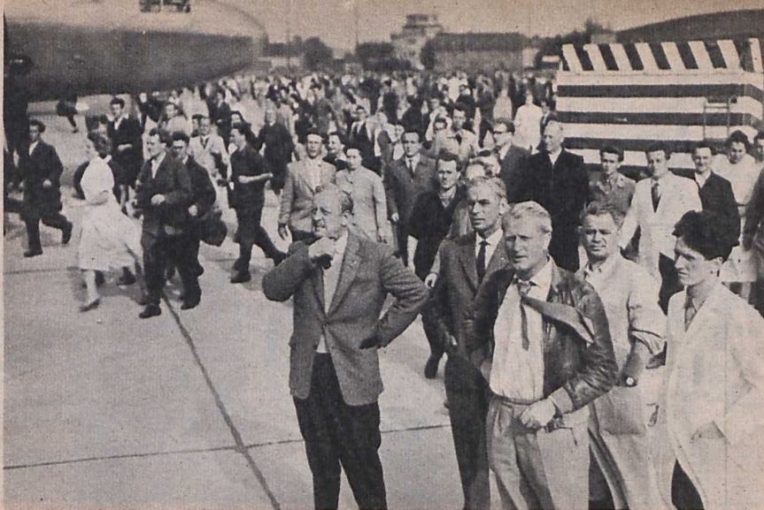
Szárnyas emberek (Középen Erwin Geschonneck)

alkotás, de nem elsősorban és nem kizárólag az. Sőt, az volt a célom, hogy úgy beszéljek erről a korról, az 1945. április—májusi napokról, ahogy az ma, majd negyedszázaddal az események után az emberek emlékezetében él.