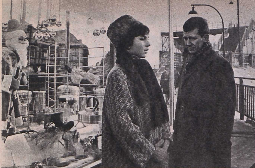
Jelenet a Megosztott ég című filmből

zéseket kifejező filmalkotás sokat segíthet ebben az esetben.