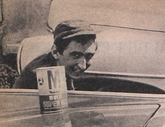
Szőnyi Mihály: Mercedes

gyon érdemes ezekről a produktumokról — s amely minimummal néhány éve a legjobbak sem rendelkeztek —, de ami ennél lényegesebb: akadt minden műfajban jó néhány olyan film, amelyik eredeti, szellemes, nagy lehetőségeket biztosító ötletre épült, s nem kevés közülük többé vagy kevésbé ki is használta ezeket a lehetőségeket.