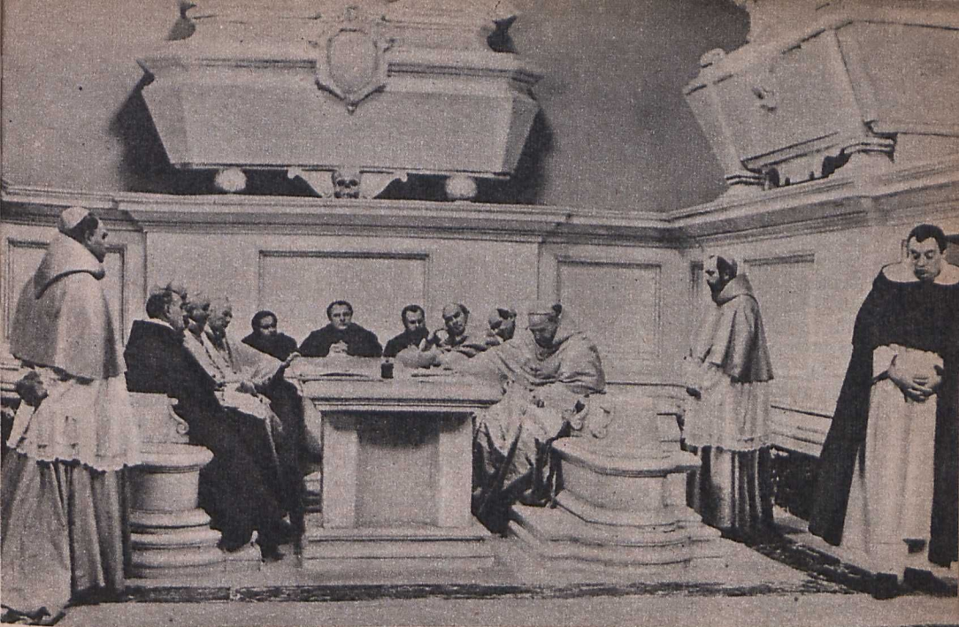
Liliana Cavani filmjének egyik jelenete

lálta magát? Próbáljuk meg a történeteket időrendi sorrendben, a lehetőség szerint logikus összefüggésben elmondani.