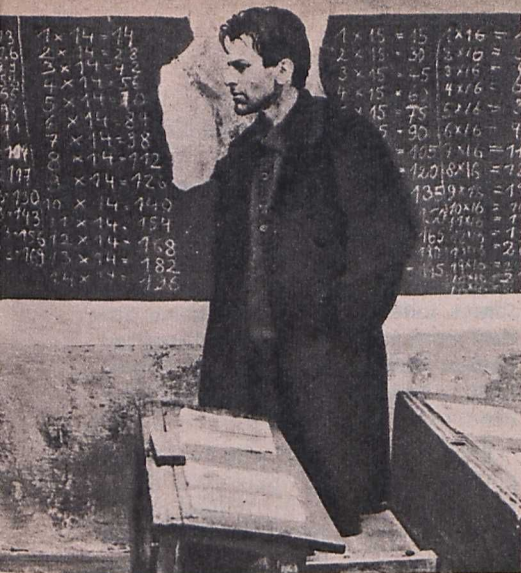
Jelenet A kastély című filmből

keresők nem sok örömet lelhetnek bennük.