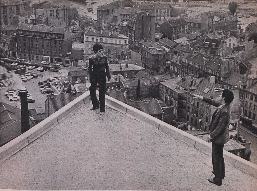
Marie-France Pisier és Samy Frey, A napok tajtékjai című filmben

gatói foteljében, fantomjaként az olasz társadalom idejétmúlt erőinek és a ... rendőrségnek.”