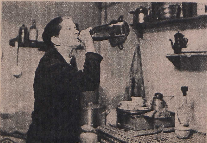
Jelenet Az alárendeltek című versenyfilmből, amely a „Ciné-nuevo” díjat nyerte San Sebastianban

Bacsó válasz helyett néhány újságkivágást tesz az asztalra. A Pueblo című lap cikkének címe: „A magyar versenyfilm, a Nyár a hegyen , a legsikeresebb filmek egyike.” Néhány mondat a cikkből: „Egyike ez a legjobb filmeknek a ritmus, a fényképezés és a téma szempontjából... Bacsónak szerencséje volt, hogy olyan kiváló színésszel rendelkezett; mint