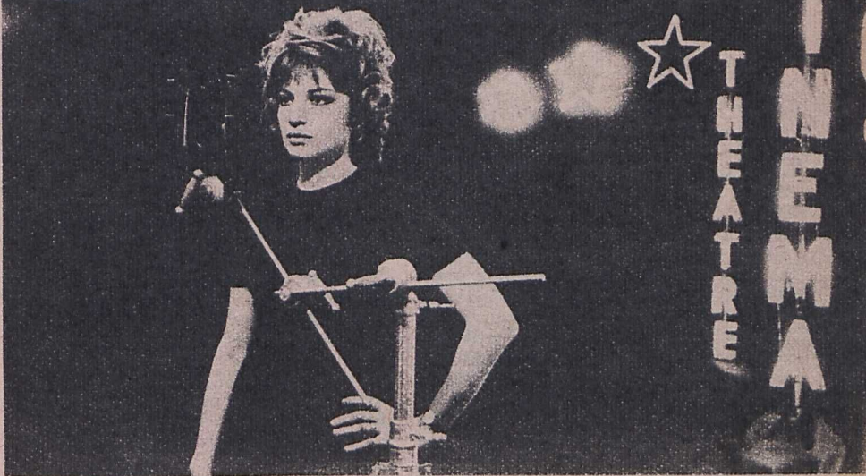
Monica Vitti nyerte a legjobb női alakítás díját, Mario Monicelli Lány a pisztollyal című filmjének főszerepéért