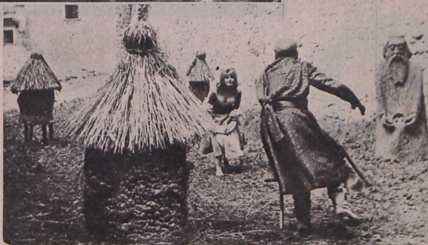
Waskowski »Tiszteletreméltó bűnök« című filmjének egyik jelenete

a »Szeretném, ha szeretnének« című pszichológiai drámát, amely tiszteletreméltó bátorsággal elemzett bonyolult erkölcsi problémákat, és mesterien állítja szembe a múltat a je-