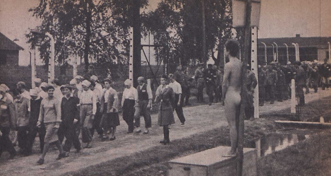
Andrzej Munk: »Idegen nő a hajón«

valamint a kosztümös »Vörös rózsza órája«-t (Halina Bielinska).