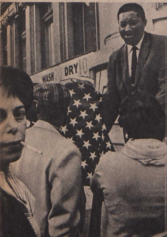
Jelenet Shirley Clarke filmjéből