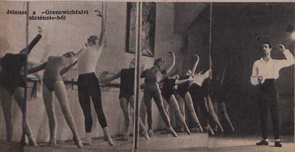
Jelenet a »Greenwichfalvi történet«-ből