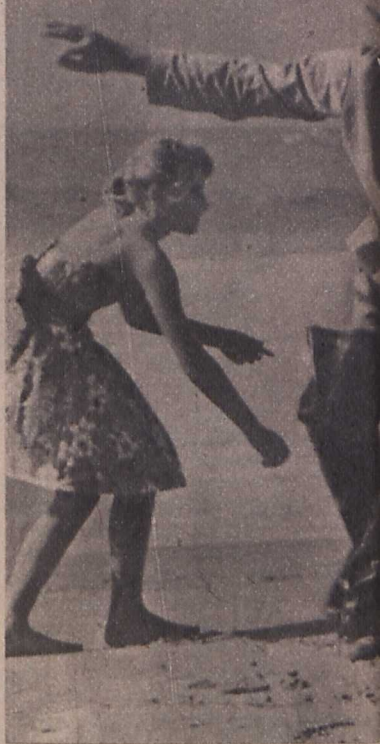
Jeroma Hill »A homokvár« címlő filmjének egyik jele- nete

majd később, amint er- nyedten leesnek, végül ismét fölemelkednek, most már üdvözlésre, varázslatos egységbe ol- vadnak a vágás ritmu- sával és az eleven ze- nyével. Az egész »Dulce domingo dulce« olyan, mintha énekelne. Ragyo- gó film, nem kétséges, hogyan szűszépet