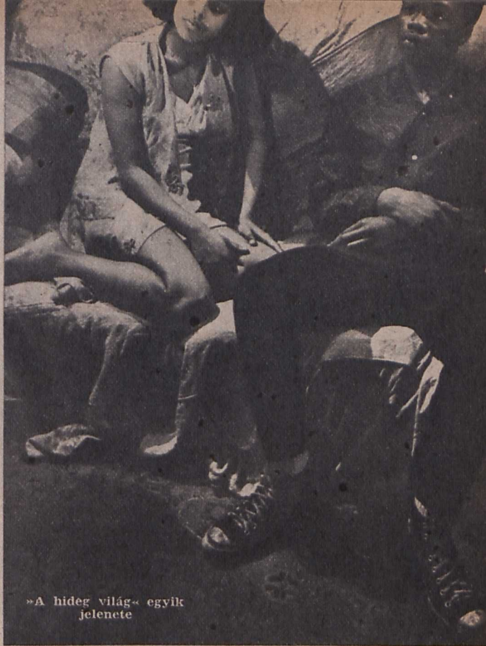
»A hideg világ« egyik jelenete

jobb. Persze, ez biztosabb is, mivel közülük kevesen tudnak hivatásos színészeket szerezni (a kisebb-nagyobb szerepeket rendszerint jó ba-