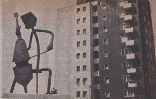
Jelenet az »Ének a vasról« című filmből