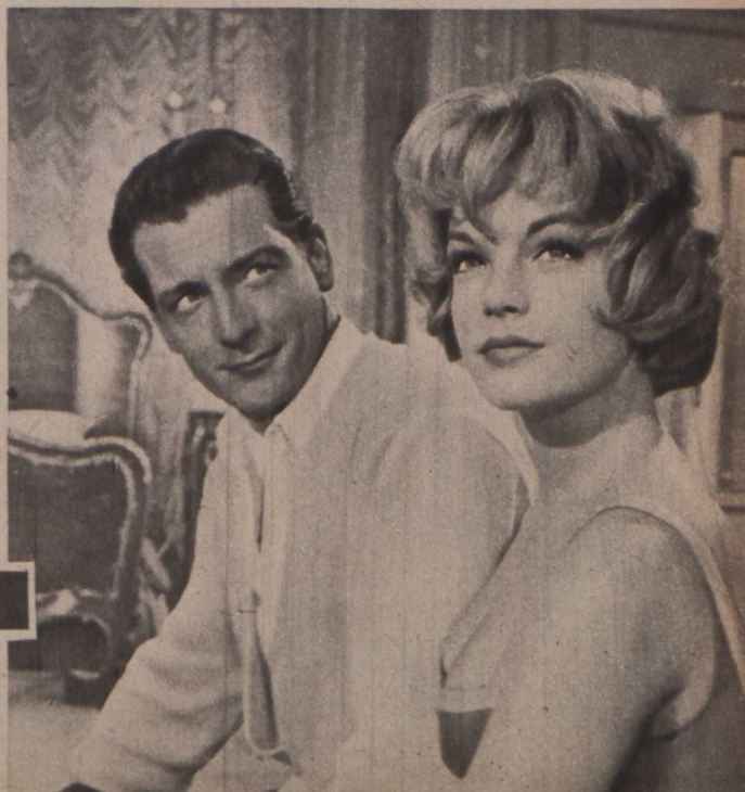
A »Félfinom« című osztrák film két főszereplője: Romy Schneider és Carlos Thompson