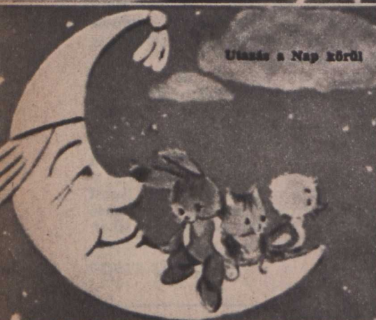
Utazás a Nap körül