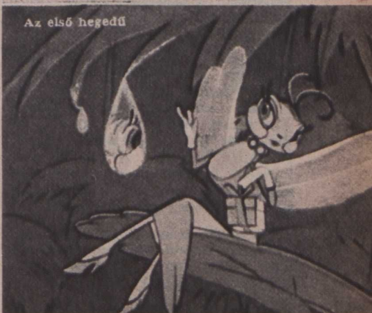
Az első hegedű