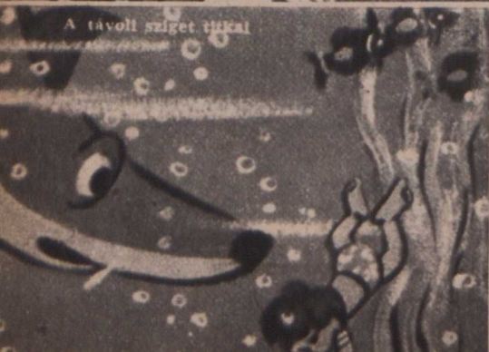
A távoli sziget titkai

Az Iszkuosztvó Kinó kezdeményezésére érdekes anketón vitatták meg a szovjet rajz- és bábfilm művészei további fejlődésük lehetőségét. Vitájuk annál is érdekesebb, mert a szovjet rajz- és bábfilmeket a világ mintegy hatvan országában játsszák, s húsz alkotást a nemzetközi fesztiválokon megjutalmaztak.