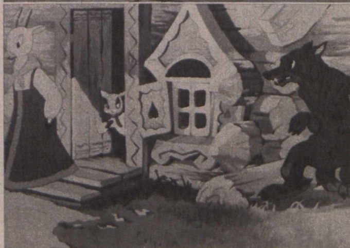
A farkas és a hét kis gida